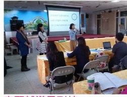
宅配輔導員到校共備成果發表暨藉景物抒情模組文本分析

世界在變！ 教師在變？ 社群共備 宅配到校 分區服務 增能研習 教學社群 資源推薦