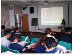
課堂教學如何與會考擦出火花