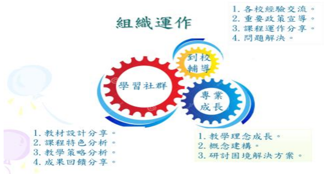
圖 2. 本土語言輔導小組組織運作架構