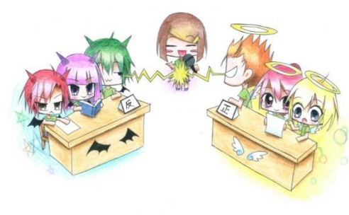
學生為辯論活動自行繪製的漫畫