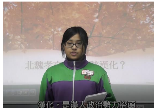
正方一辯，提出論點