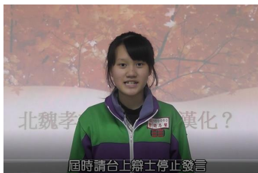
辯論活動的主持人