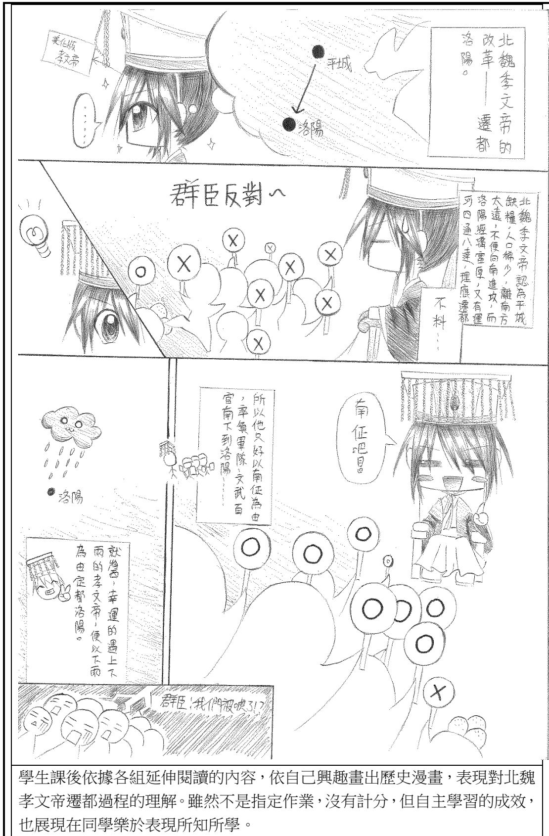
學生課後依據各組延伸閱讀的內容，依自己興趣畫出歷史漫畫，表現對北魏孝文帝遷都過程的理解。雖然不是指定作業，沒有計分，但自主學習的成效，也展現在同學樂於表現所知所學。