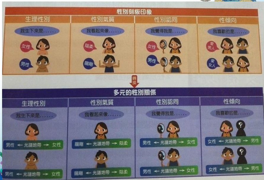
圖 2-10 我們應打破性別刻板印象，以多元的觀點看待性別議題。