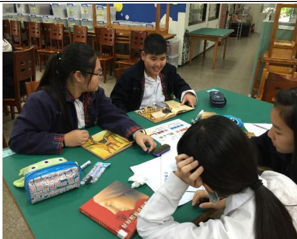
說明：學生依學習單提問，熱烈討論中