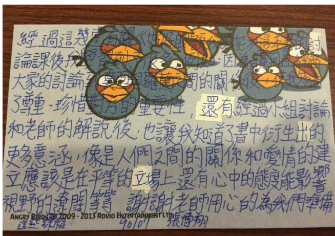
說明：學生的心得小回饋卡