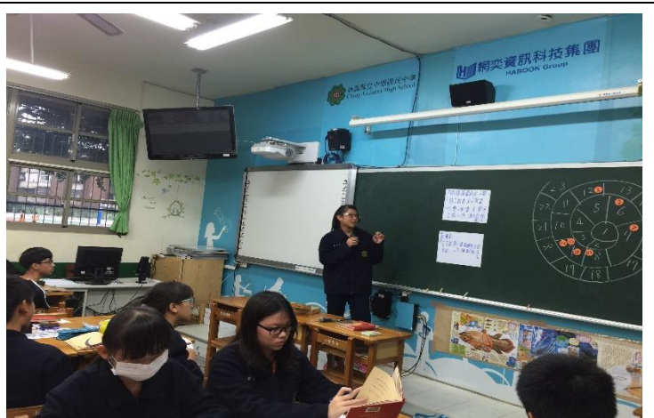
說明：學生將討論內容輪流上台報告 教師即時澄清回饋 及統整