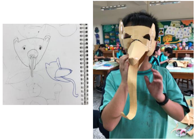
生態資料收集(使用速寫本教學用於預習)