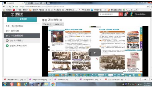
(B)觀看「課外視讀」：視讀「相關紀錄片」