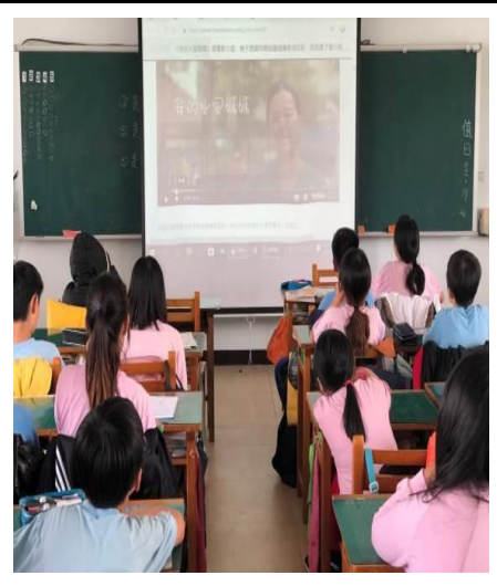
說明：介紹我的媽媽是火星人