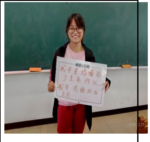
說明：分享媽媽的圓夢計畫