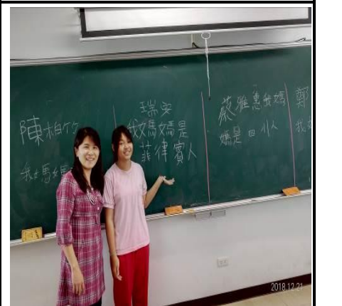
說明：孩子介紹媽媽的家鄉