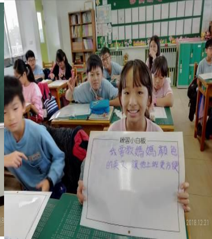
說明：分享媽媽的圓夢計畫