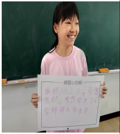
說明：分享媽媽的圓夢計畫