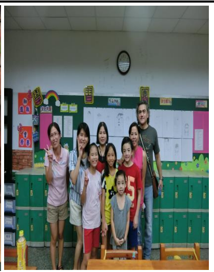
說明：神秘嘉賓蒞臨