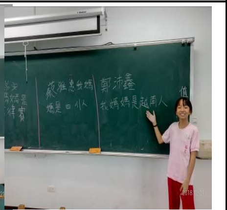
說明：孩子介紹媽媽的家鄉