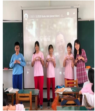
說明：班上新住民孩子