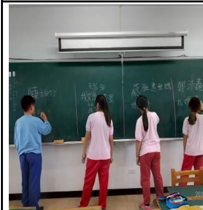
說明：孩子介紹媽媽的家鄉