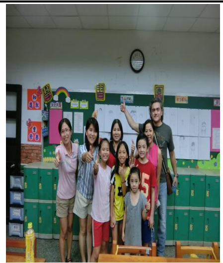
說明：神秘嘉賓蒞臨