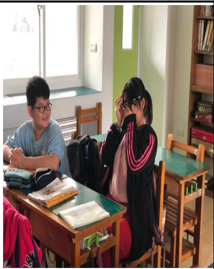
說明：孩子觀賞我的媽媽是火星人，感動落淚