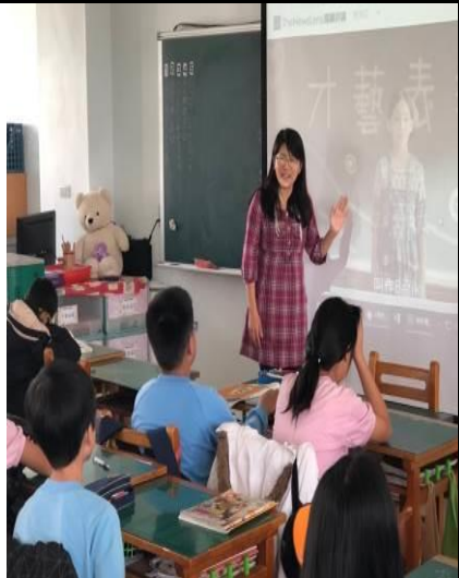
說明：介紹我的媽媽是火星人