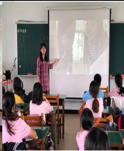
說明：介紹我的媽媽是火星人