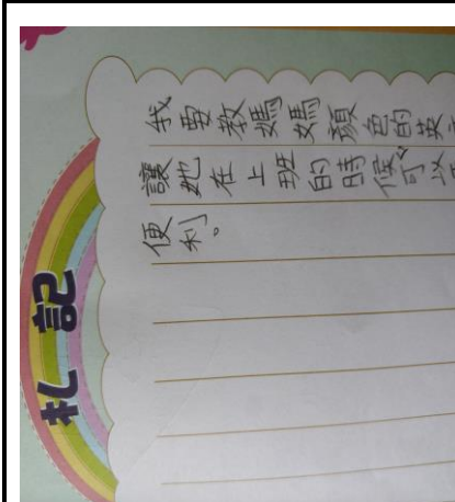
說明：寫下媽媽圓夢計畫