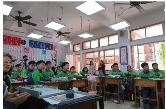
學生上課相當專注