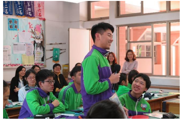
學生表達對議題的想法