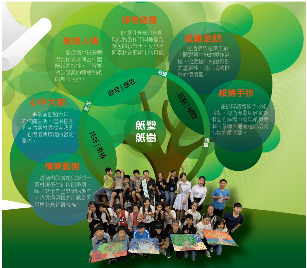
課程設計理念與架構圖

十二年國教課綱之素養導向課程著重學生在生活情境中發現問題、解決問題進而培養正確的生活態度。感恩---課程從紙漿人偶開始，以創造思考討論教學，引發學生對環境的尊重感謝與對自己未來的期許，利用廢紙與自然素材製成紙漿，期許學生能感念自然環境給予人類的付出，進而發覺自我；惜物---參訪再生紙廠體認紙的再造、紙博物館中體驗手抄紙課程與藝術家用紙來創作的意涵，期待學生在生活中能愛物惜物。祈福---畢業前回顧六年校園的人事物給予學生的中心價值，透過樹的議題與紙漿土素材讓學生創作四季樹，除了給予自己畢業的期許，也透過這樣的活動為同學與師長祈禱祝福。