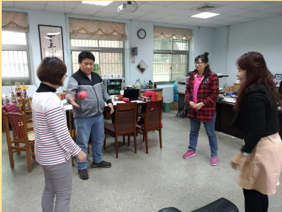
輔導員與潮音國小的夥伴嘗試進行課中的活動，去調整。