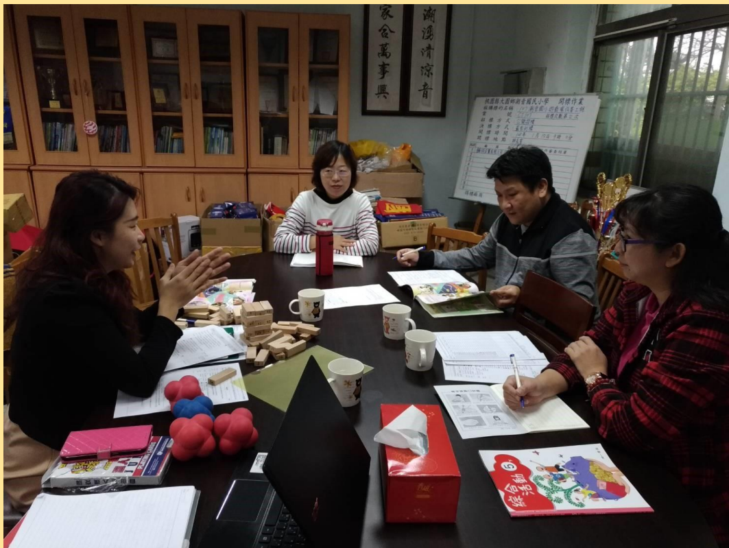
教務主任帶領團隊與教學者共備。