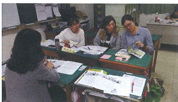
▲107 年 12 月 5 日：佩樺老師文本分析