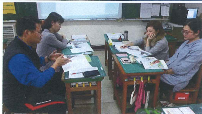
▲107 年 12 月 5 日：繁淵老師文本分析