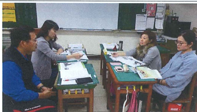
▲107 年 12 月 5 日：瑞貞老師文本分析