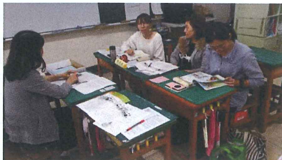
▲107 年 12 月 5 日：美霞老師文本分析