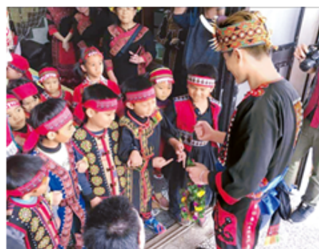
臺東縣安朔國小學生都穿上排灣族傳統服裝參加婚禮。