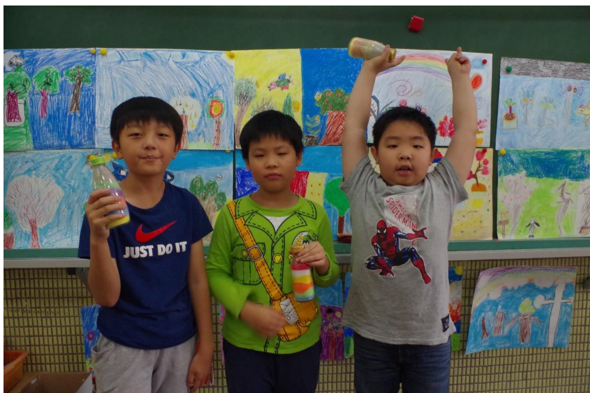
展示自我，肯定自己