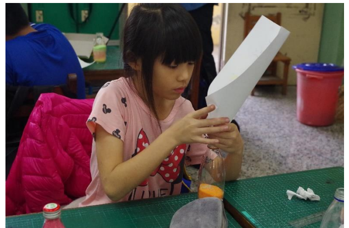
學生專心操作，享受其中樂趣