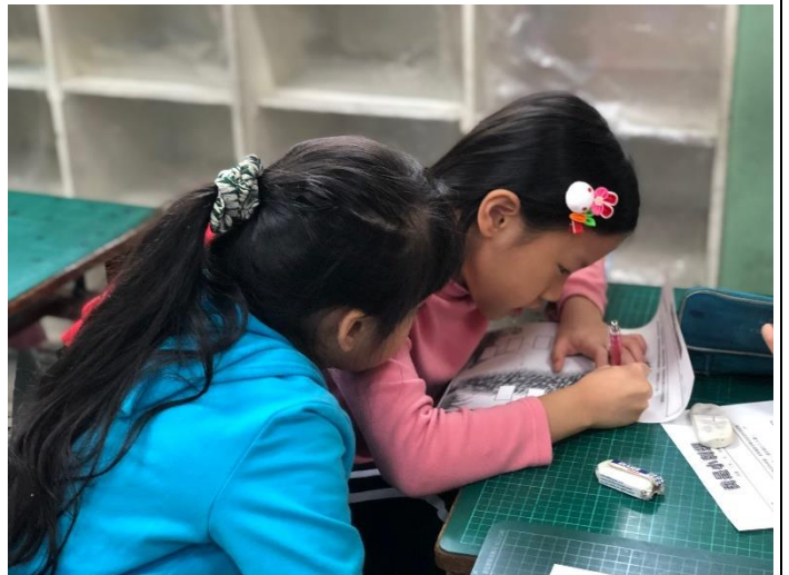
繪本討論，深思體量