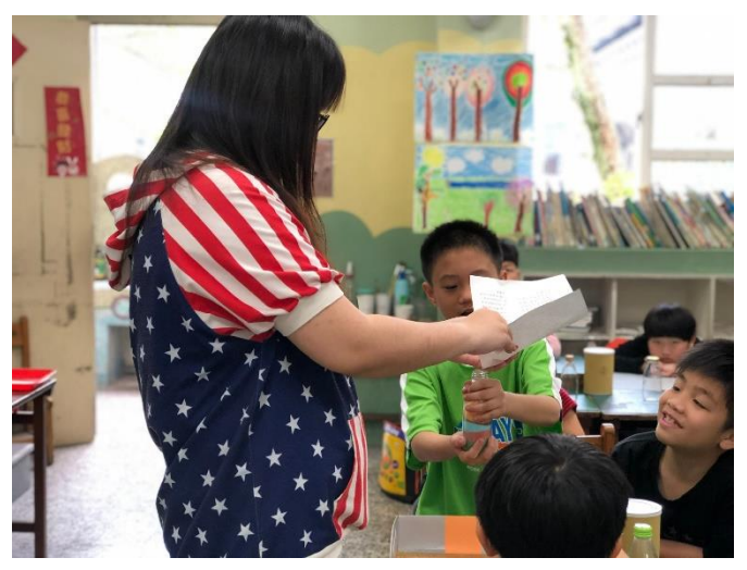
教師示範實作步驟