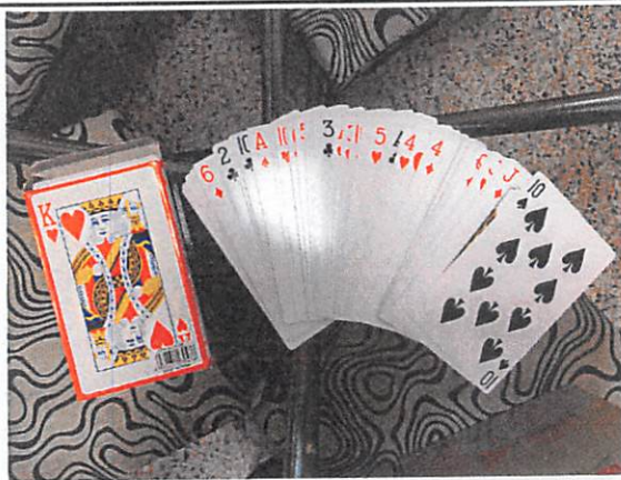
說明：教師給學生的加分牌 (小)