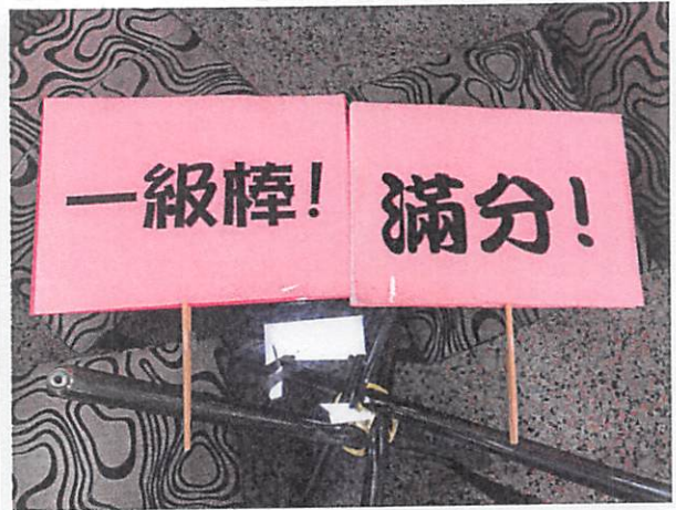
說明：教師給予學生表現的回饋牌