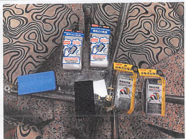
說明：請小組討論時的環保板擦。