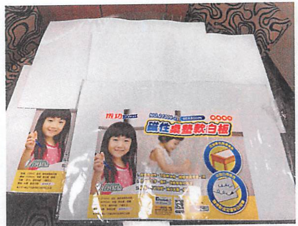
說明：請小組討論時的環保 A3 白板。