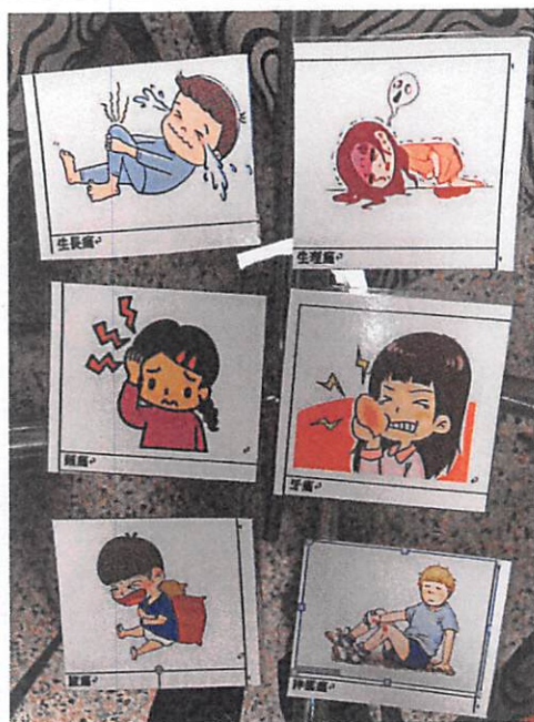
說明：請小組討論時的痛感牌。