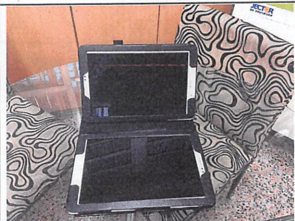
說明：請小組查資料及進行卡呼用的平板。