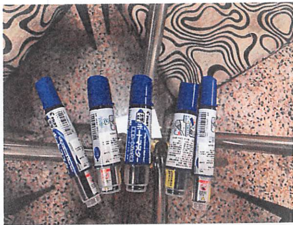
說明：請小組討論時的環保白板筆。