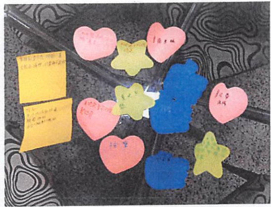
說明：請小組討論時的便利貼