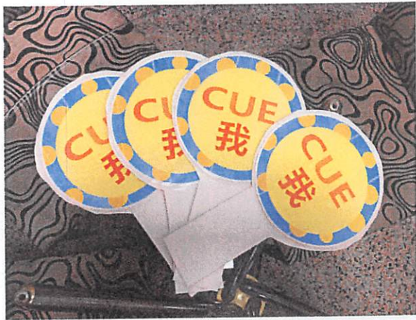
說明：教師請小組完成時舉的牌子，可立即加分