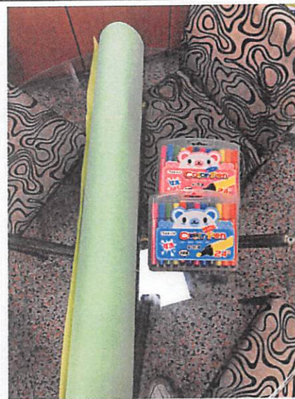
說明：請小組討論時的海報及彩色筆。