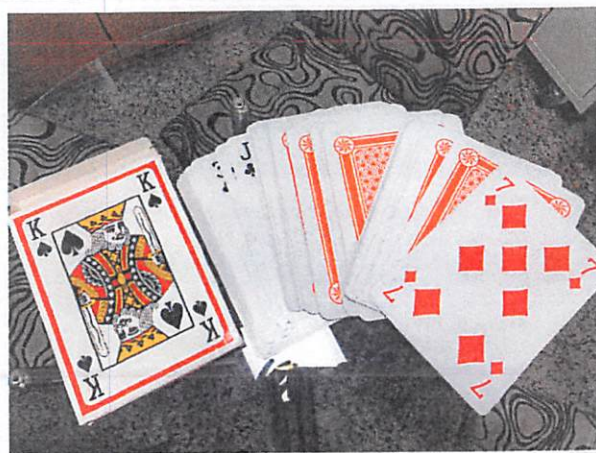
說明：教師給學生的加分牌 (A4)