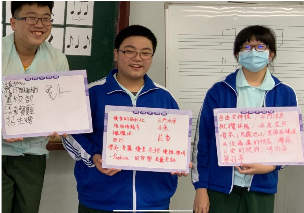
其他班級校園特色討論結果以小白板呈現(804)