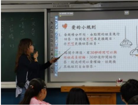
教師詳細說明進行方式與規則