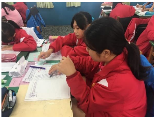
專注學習探索，勇敢成就自我