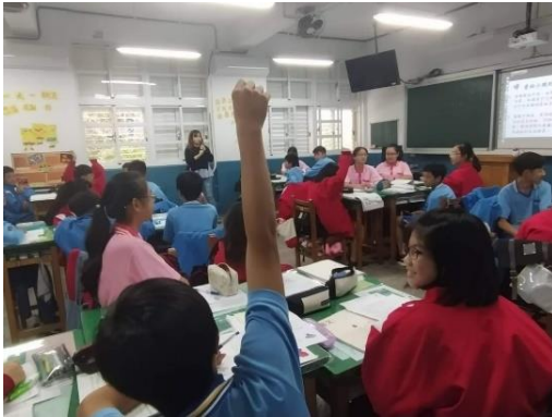
學生積極發言，成為學習的「主人」

教授與老師們建議，授課教師可將規則講解時間縮短，將時間保留給學生直接進行活動，若有問題可再隨時處理。