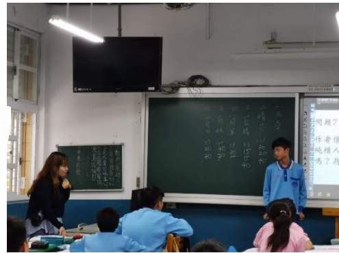
小精靈勇敢上台，教師具體引導

教師不停鼓勵程度落後學生，看見學生從害怕到勇敢說出答案，雖然臉上學生依舊有些許不肯定，但勇敢挑戰的過程讓人動容！這正是課堂最美的風景！