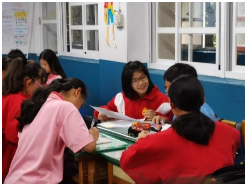
分組合作學習，友善互助共成長