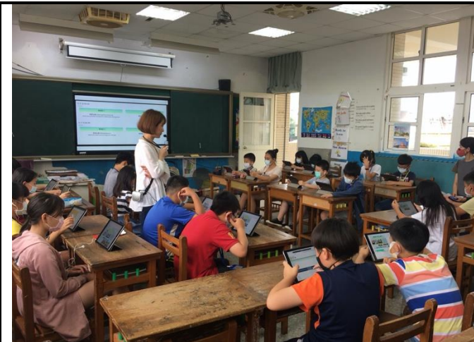
觀課-學生使用因材網預習目標單字與句型