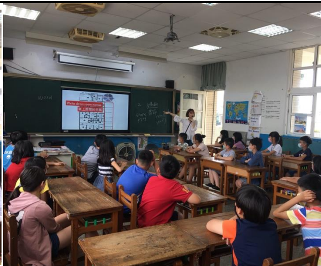
觀課-小組活動說明