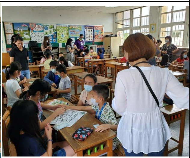
觀課-進行小組活動