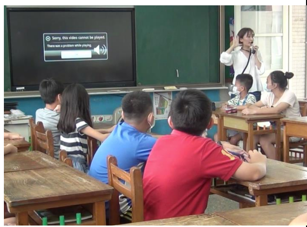
觀課-聲音提示猜測活動