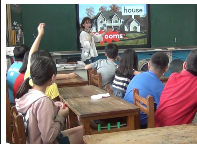
觀課-引起動機情境引導