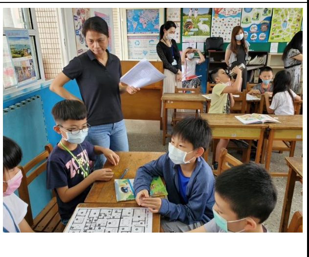
觀課-進行小組活動