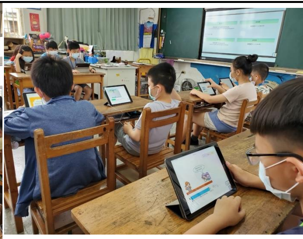
觀課-學生使用因材網預習目標單字與句型