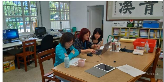
說明：跨領域教師共備產出