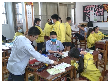
▲ 第四節課：對消費者行銷自己的產品。