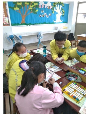
▲ 第三節課：製作自己的行銷海報。