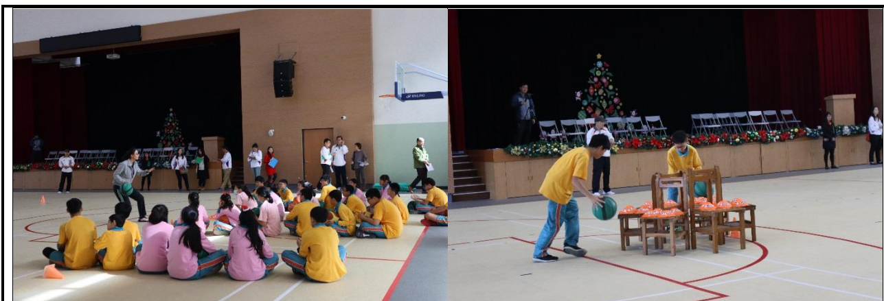
說明:老師講解運球的基本動作