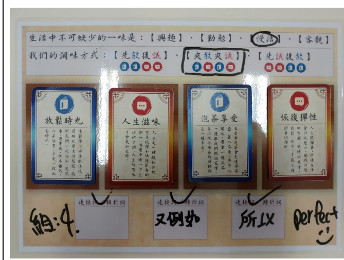
學生小組合作架構之文章成果-1