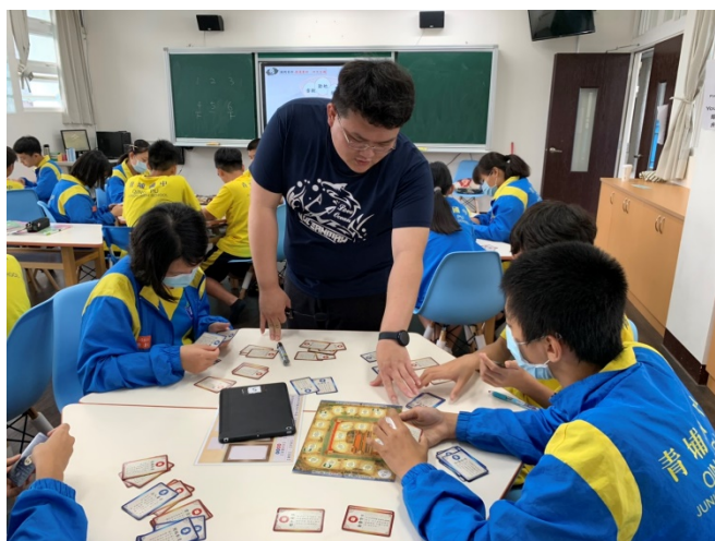
教師引導學生進行桌遊