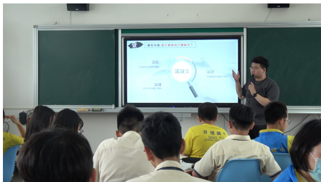
教師說明議論文組成要素