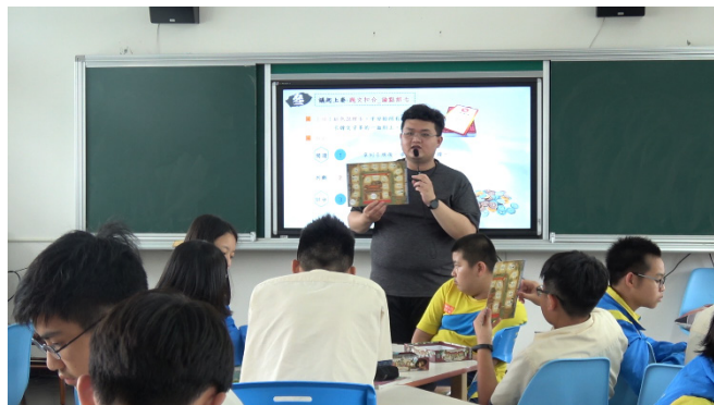
教師說明桌遊規則並引導學生進行遊玩