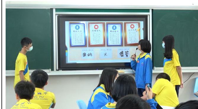
學生上台發表成果