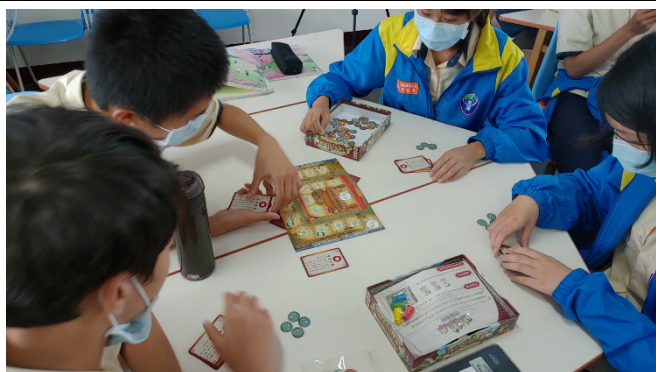
學生藉論點牌妻遊戲練習題文扣合