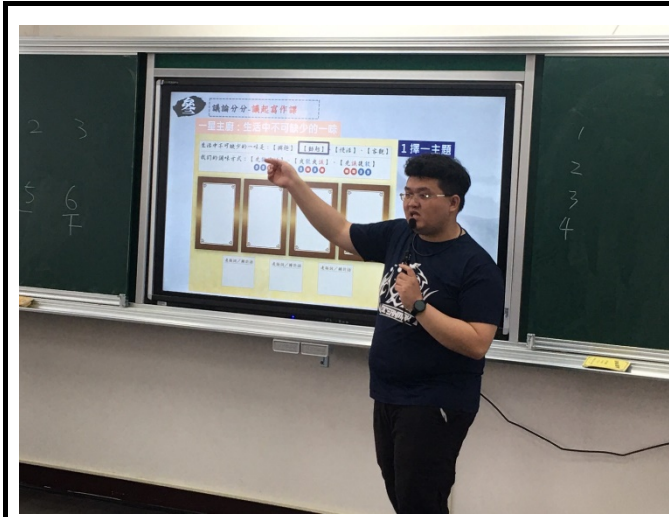
教師說明寫作版卡操作方式