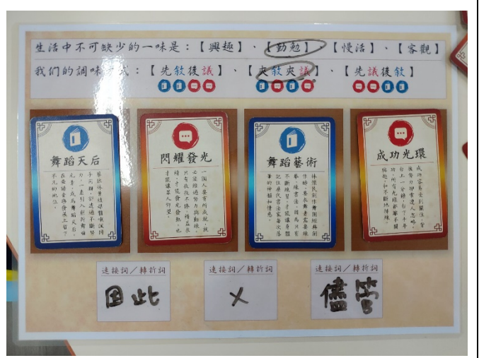
學生小組合作架構之文章成果-2