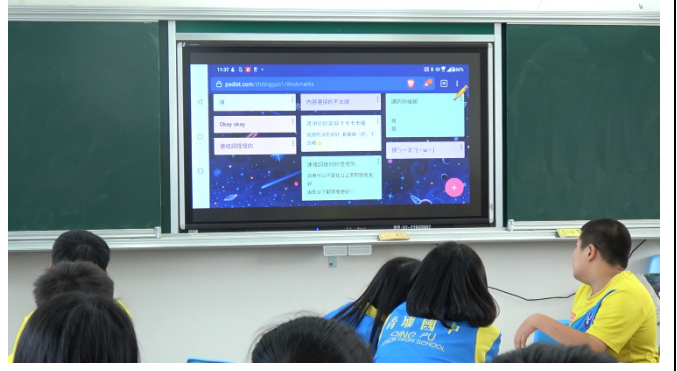
學生以 Padlet 進行小組互評