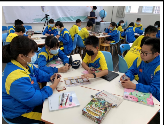
學生利用桌遊排卡與寫作版組織文章