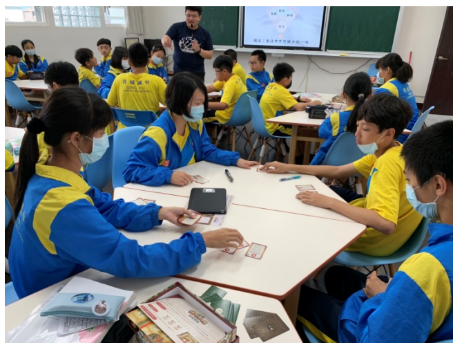
學生將牌卡依主題分類