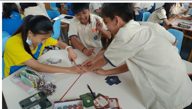
學生熱烈遊玩論據心臟病中