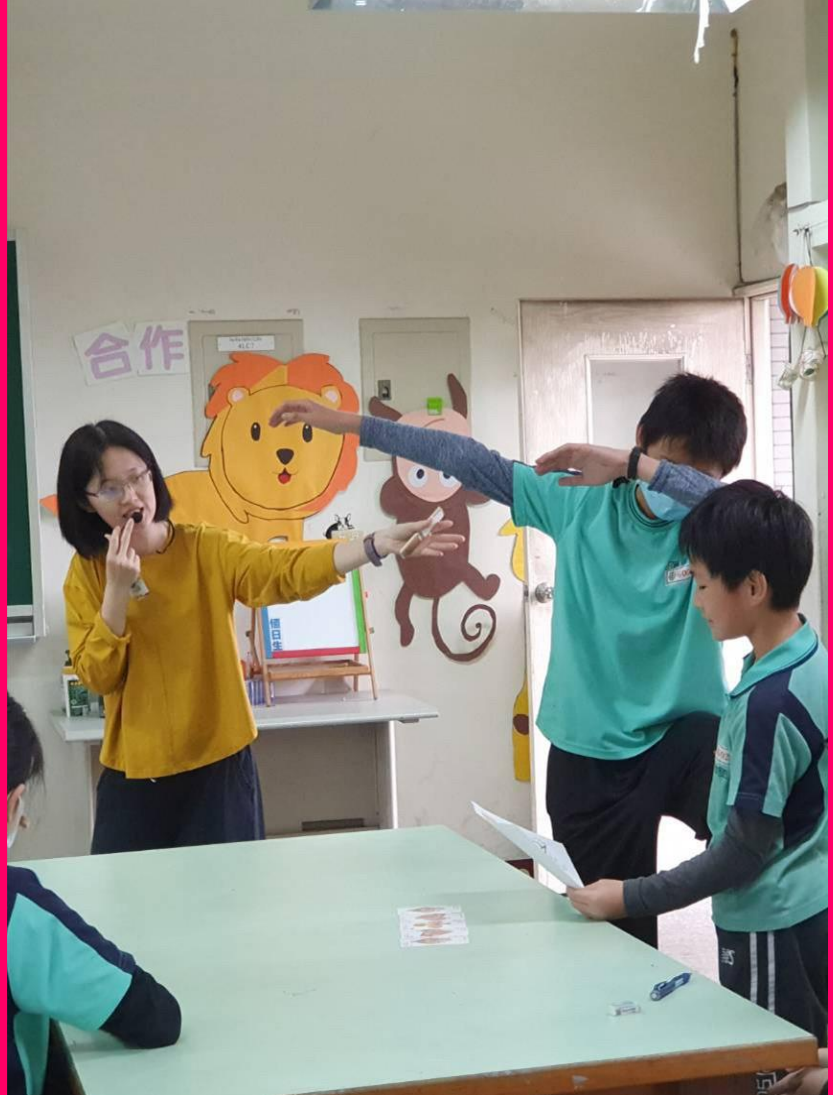
愛好自由的男神維納斯