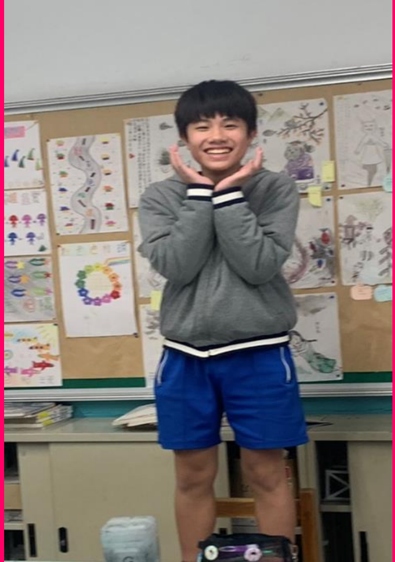
可愛氣質的男神維納斯