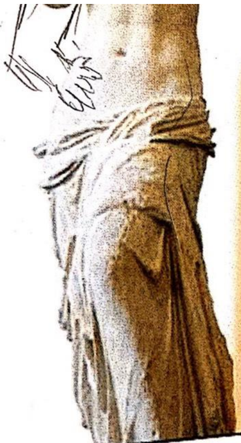
象徵「愛」與「美」 的維納斯