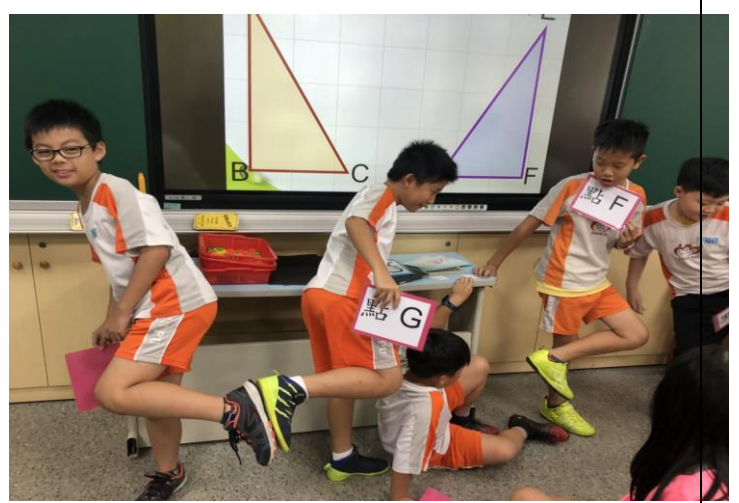
從配對遊戲中檢驗教學目標，學習更加紮實