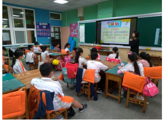
歸納全等圖形的概念