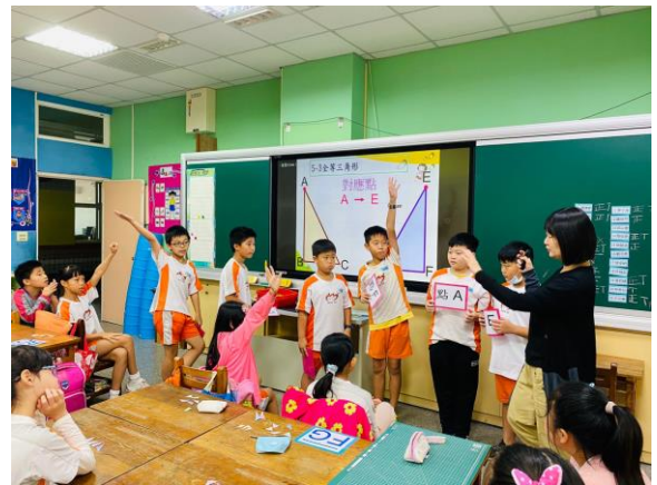
提問策略引導，讓孩子用自己的話說，釐清概念！