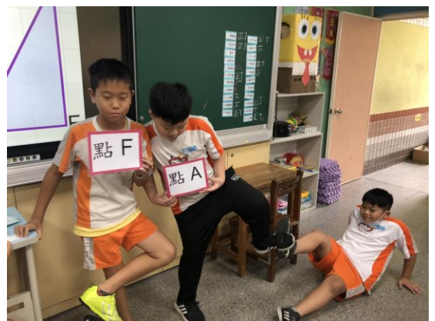
遊戲化教學，多元動態評量！