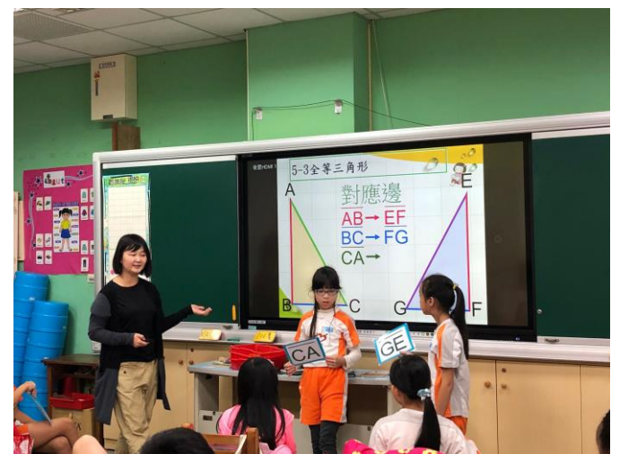
找出全等三角形的對應邊、對應角和對應點。