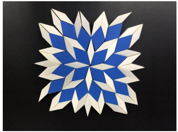
全等圖形「重複美學」創作體驗活動，欣賞孩子們的作品！