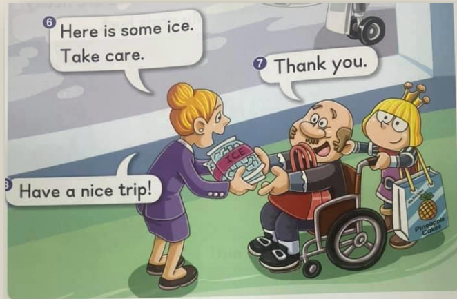
Prince Bruce and Fred are on the plane.