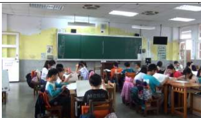
引起動機~「悅」讀同學的來信