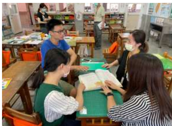
教學者說明觀課重點