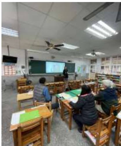
說明 Jamboard 的操作