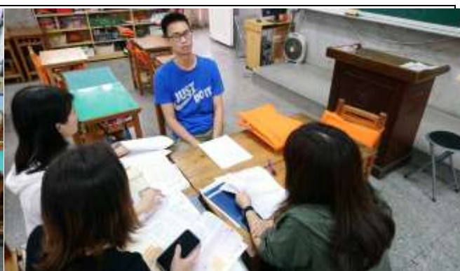
觀課老師進行回饋與建議