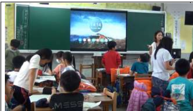
小組互動，分享者起立，輪流分享。