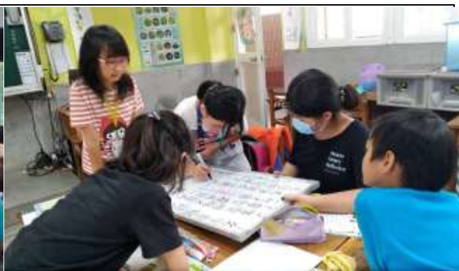
條列出組內共同發現