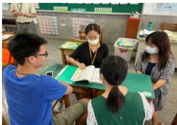
教學者說明上課內容與流程