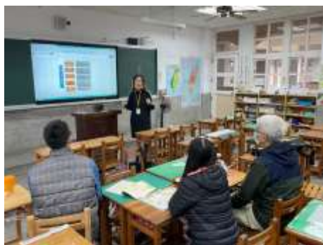
教學者說明課程設計理念與課程架構