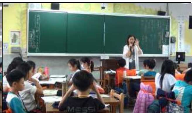
教師引導學生如何進行組內分享