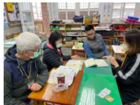
共備老師們提供意見