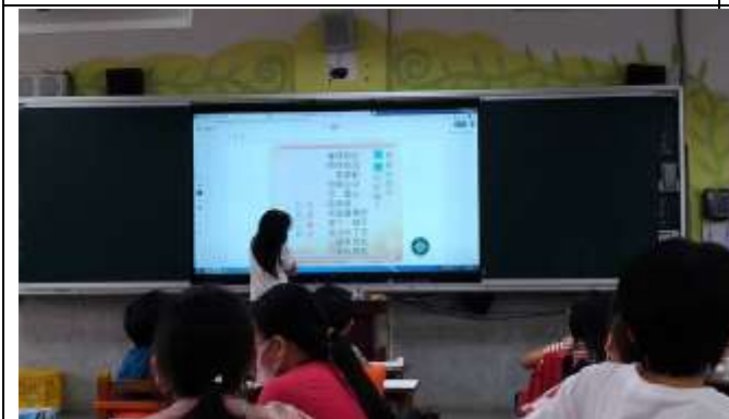
聽得懂卻不一定能馬上做到對