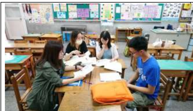
教學者觀課後省思心得分享