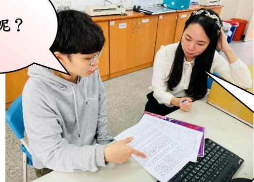
▲專業對談 分享初步教案內容，討論授課流程，模擬實際教學時的順序。