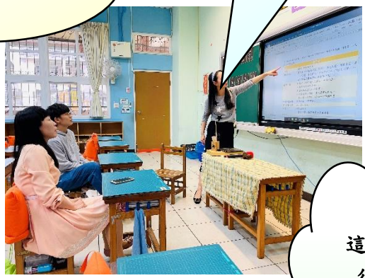
▲科技設備與資源的嘗試 領域老師們分享不同科技設備、軟體，討論其優缺點，選擇最適合一年級學生的設備。