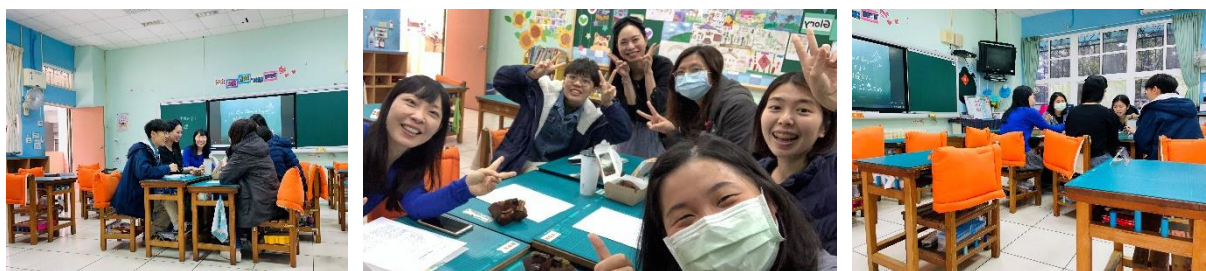
▲一年級學年老師與教務處團隊 議課過程