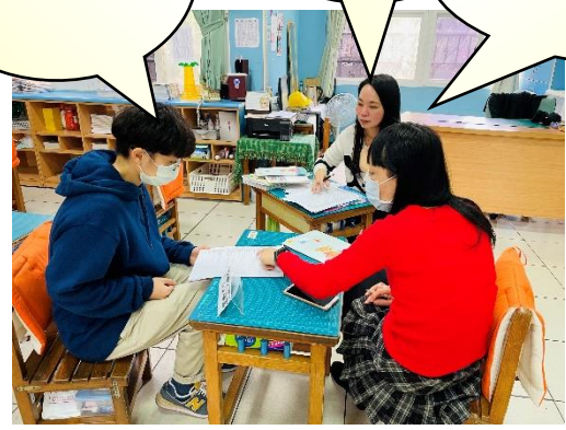
▲共創教學靈感 如何結合實際課程教學、素養、科技、雙語等要素的教案設計。