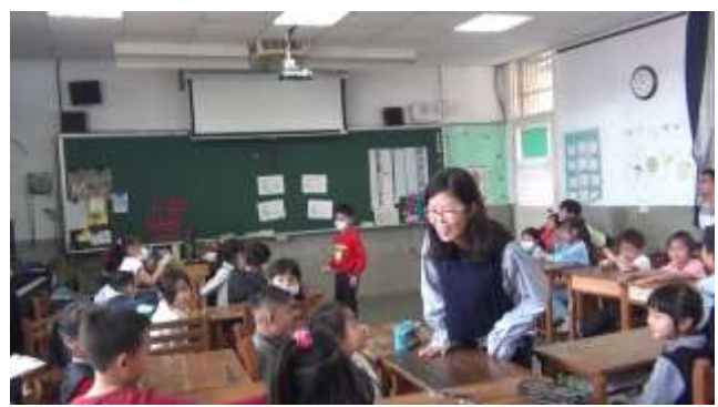
觀課-音高辨認遊戲