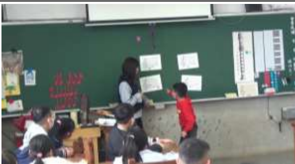
觀課-音高辨認遊戲