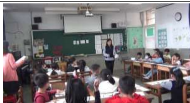
觀課-節奏教學(仿念)