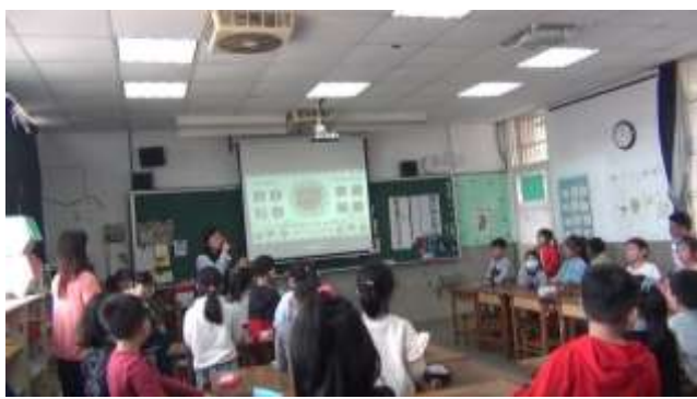
觀課-搭配獅王進行曲肢體表演