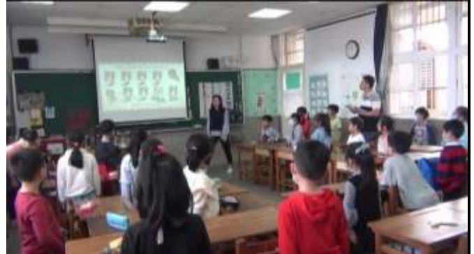
觀課-搭配獅王進行曲肢體表演