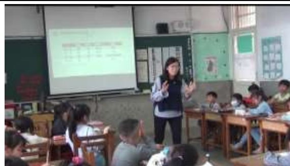
觀課-辨別高低、快慢及特性