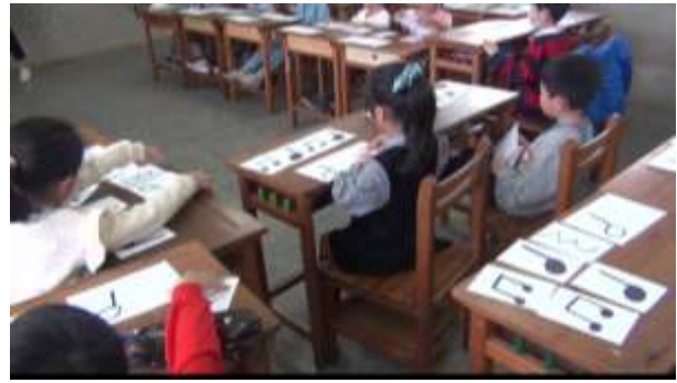
觀課-節奏教學(排卡)