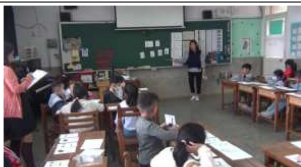
觀課-節奏教學(仿念)