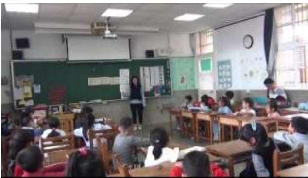
觀課-音高教唱及辨認