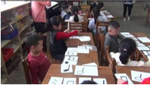
觀課-節奏教學(排卡)