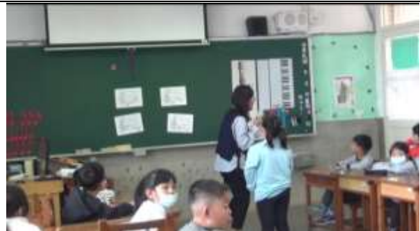
觀課-音高辨認遊戲