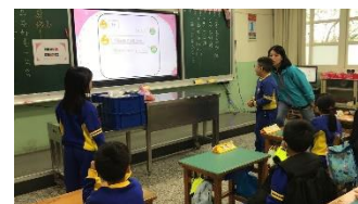
學生用心聆聽 學生開口練習