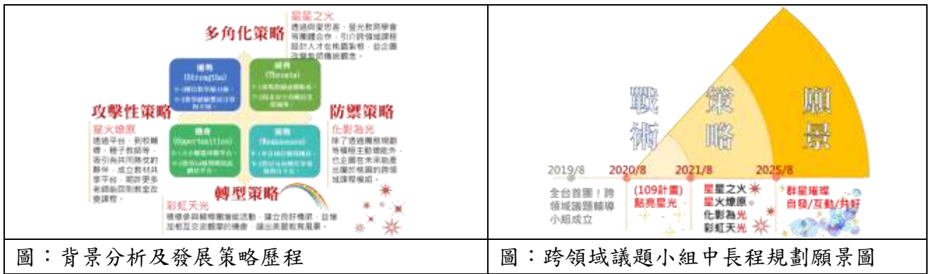
圖：背景分析及發展策略歷程