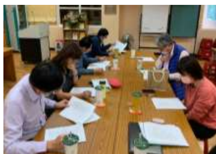
雅文老師說明課程調整細節