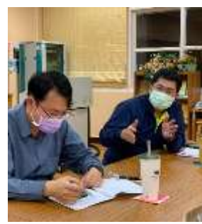
書銘主任提供建議