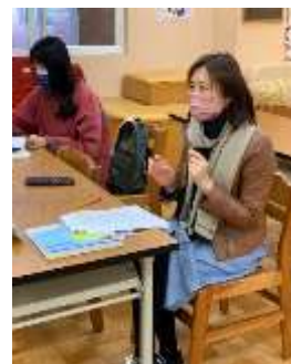
芝蘋主任提供想法