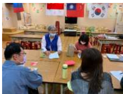
永照主任提供建議