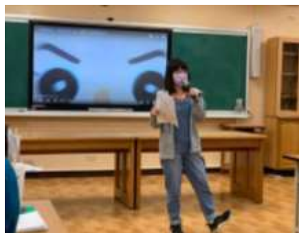
雅文老師說明課程設計