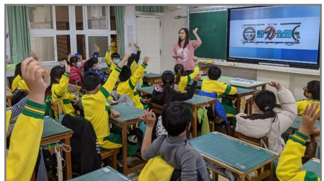
用中年級的課文，依序介紹四種寫作開頭方式，並進行舉手互動的提問情境。