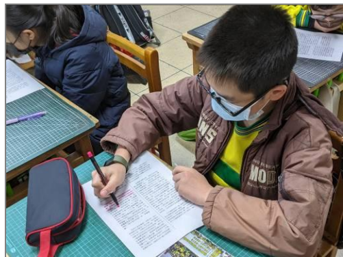
被雨水擊掉的一天

你去過六福村嗎？在六福村，哪一個設施，你印象最深呢？你有對六福村之震撼到過嗎？在六福村，令我印象最深刻的自然就是全國最高的海盜船，為了這次的六福村之旅，我期待睡不著！但那时的我並不知道明天將會是悲慘的一天！