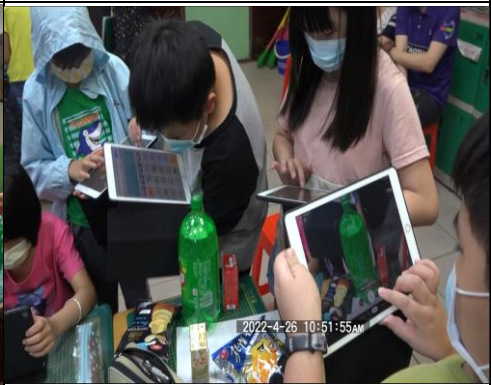
利用E化工具查價格