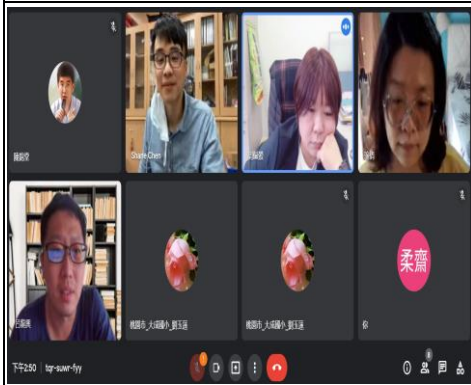
利用網路與校外人員共備