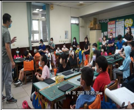
引起動機：舊經驗復習