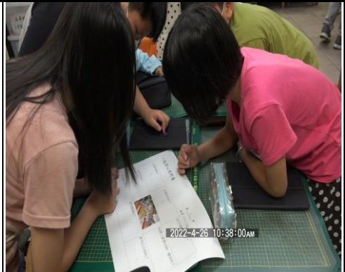
討論預計的選購條件