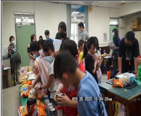
小組討論後的實際選購