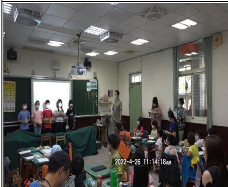
小組發表採購結果