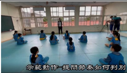
示範動作-提問節奏如何判別