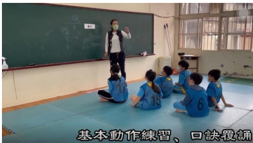
基本動作練習、口訣覆誦