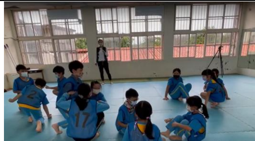
說明:分組遊戲-梅花梅花幾月開