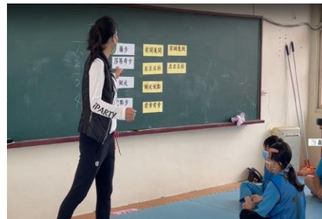
說明:側走步動作示範