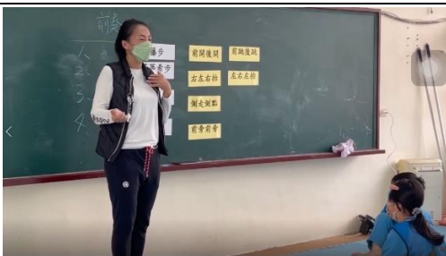
說明:四個基本動作歸納整理口訣