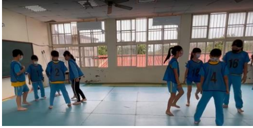
說明：各組自行動作練習