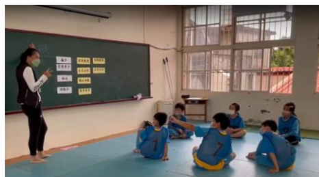
說明:動作節奏提問學生口頭回答