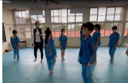
說明:自行走動用腳跟節奏一起踩拍