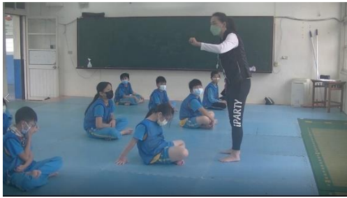
說明:規則說明,聽節拍節奏時握拳停止出聲