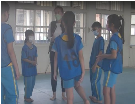
說明：教師給予各組協助指導