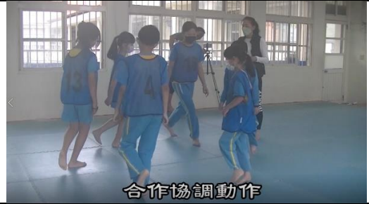
說明：分組練習時合作協調動作