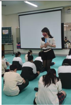
教師教室走動，事實檢視學生的學習情形