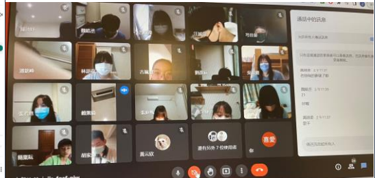
課堂中鼓勵學生開鏡頭師生互動良好