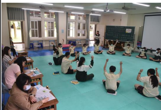
藉由教師共同觀課的方式，實踐「教師有效教學」、「學生有效學習」的教學目標