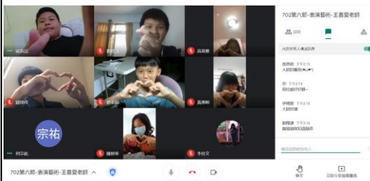
教學不再受限於教室，而是隨時隨地都能有效教學