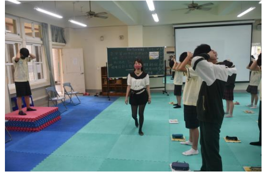
教師巡視走動提醒動作有無做錯