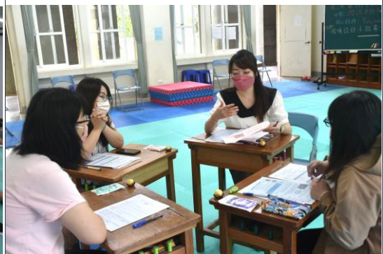
共同議課分享經驗、討論教法，大家彼此切磋交換心得，督促自己自我反省持續在教學的正向循環中成長