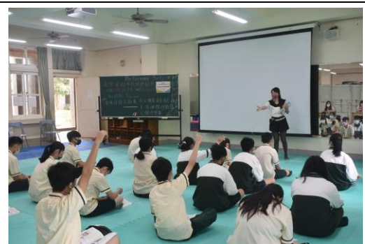
善用問答提問加分，引發並維持學生學習動機