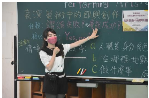
運用板書連結學生新舊知識，清楚說明本堂課學生學習的任務，讓孩子期待整節教學流程(講述教學法)