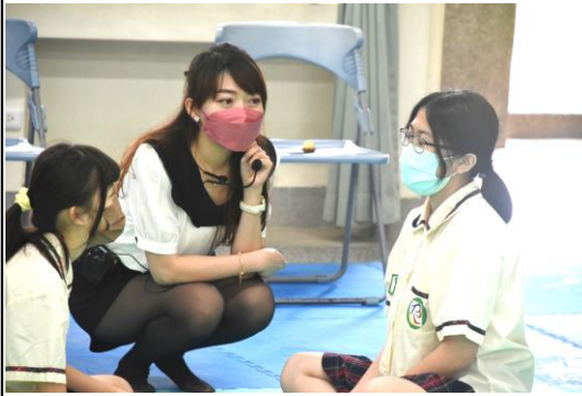
教師到各組走動，眼神能關照多數學生 (分組學習法、討論教學法)