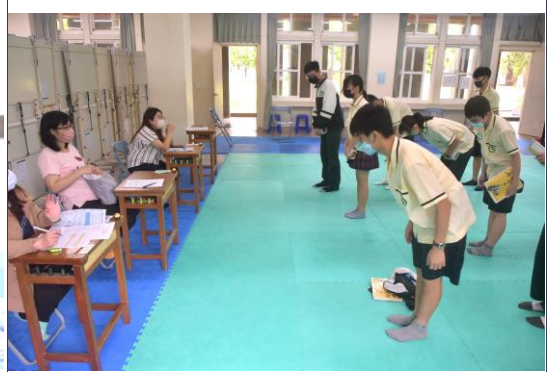
培養學生感恩的心，下課同時也謝謝觀課的老師們