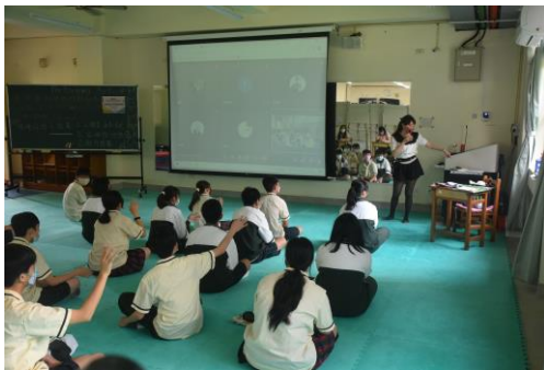
實體上課學生與居家隔離、防疫假的學生透過鏡頭打招呼(混成教學法)