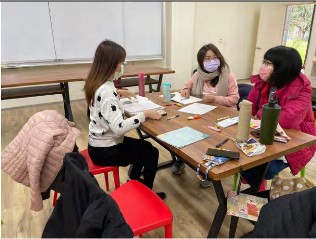
說明：美感體驗教育計畫實施內容討論