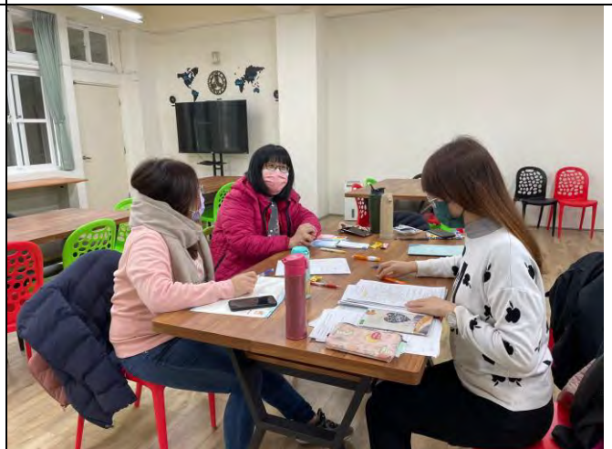
說明：討論命題及審題原則，平均分數不宜低於 50 分