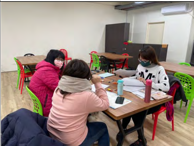
說明：生命教育融入藝術領域各科分享