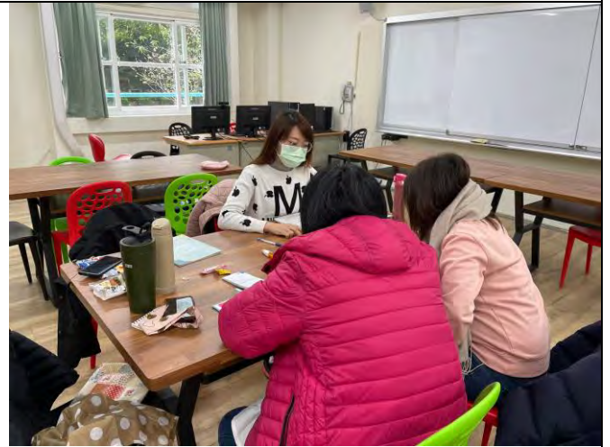
說明：教師專業學習社群揪團共備課程