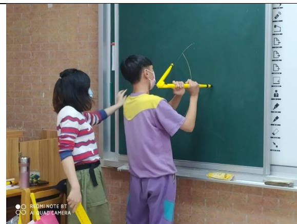
上台實作，教師適時給予回饋