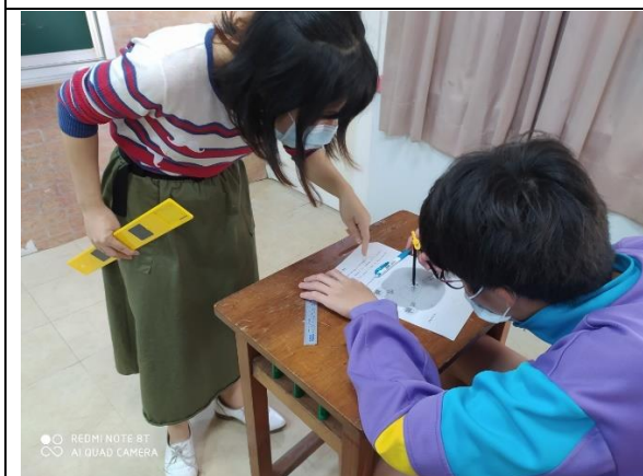
走動觀察學生學習狀況