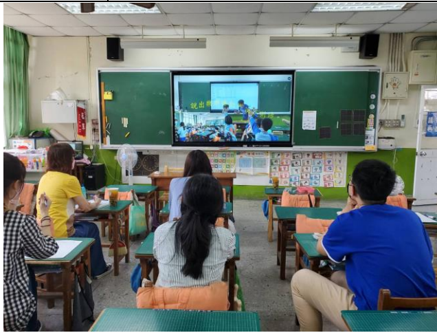
說明：教學影片進行觀課