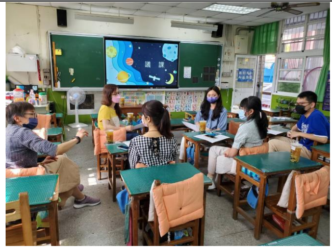
說明：互動回饋討論熱烈