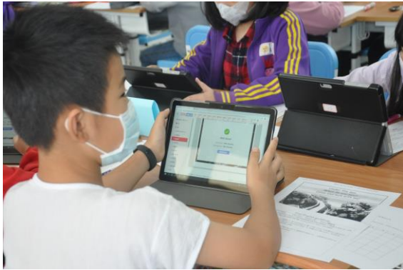
圖三 學生看平板” Under the sea”