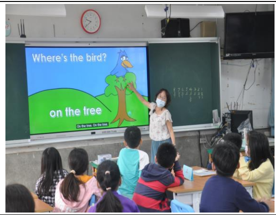
圖二 唱 Where is it?