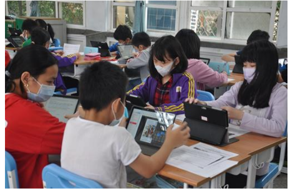
圖四 學生討論題目