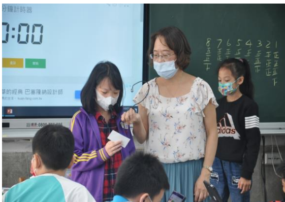
圖五 各組上台發表