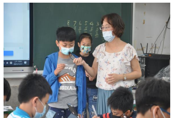
圖六 各組上台發表