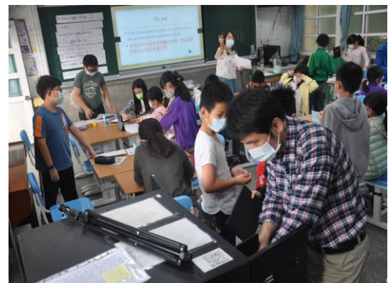
圖八 教師導讀後收回平板