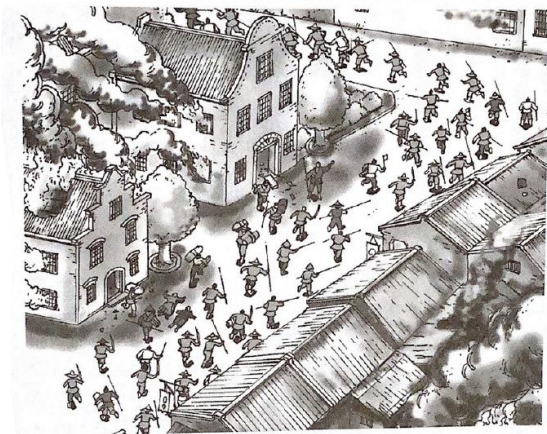
郭懷一率領漢人農民攻打普羅民遮市街。

然而，沉重的稅金繳交制度在收成不佳的時候更成為在臺灣生活的漢人很大的壓力來源，引發多數人的憤怒，大家因此串連要一起推翻荷蘭人的統治，並且推選郭懷一擔任大家反抗的領導者。郭懷一本身是油行商人，本來計畫要邀請荷蘭官員一起飲酒同樂，再以送他們回家為理由攻佔熱蘭遮城。想不到這個計畫還沒執行前就被郭懷一的結拜兄弟洩漏給荷蘭當局，郭懷一只好匆促的帶領漢人農民提早攻打臺南赤崁的市街，早以得到消息的荷蘭人擁有強大的火力軍炮，甚至還結合原住民加入戰鬥，答應原住民「每殺一人就送一塊布」。這些漢人農民在敵不過荷蘭攻擊，在這場抗爭行動中，郭懷一及