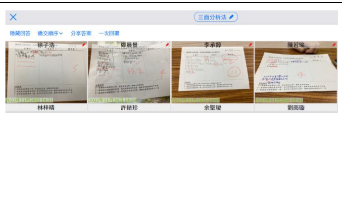
四組三面分析表繳交