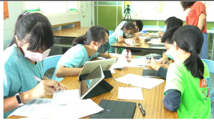
小組進行三面分析討論