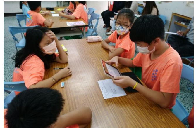
學生利用平板上傳討論結果