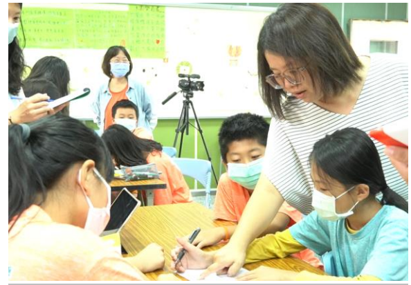
組間巡視學生討論狀況並給予協助