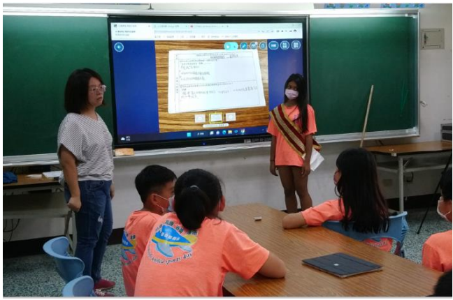
學生進行角色扮演，分享角色扮演思考與心得