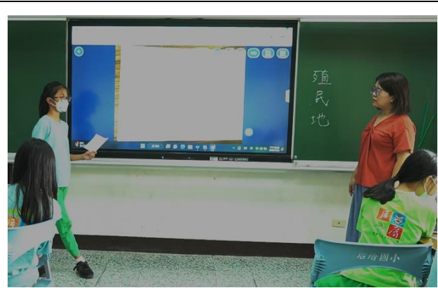
小組輪流上台報告組內三面分析內容