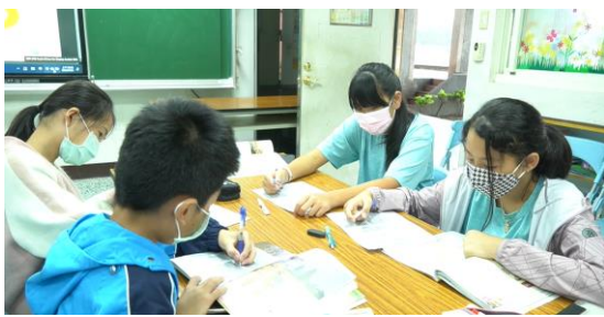
學生進行專家小組討論