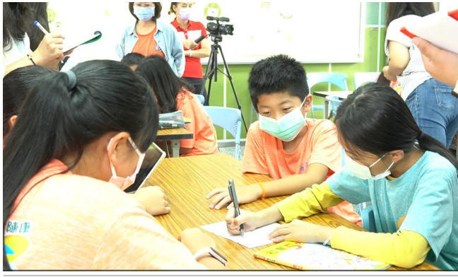
學生進行情節討論單討論