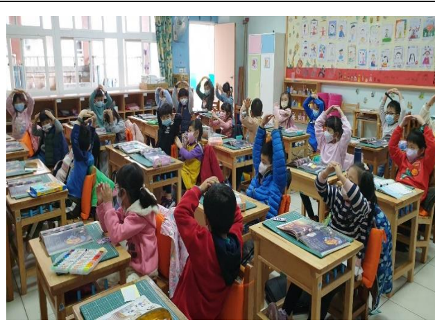
說明：過新年傳統習俗認知 OX 手勢評量活動