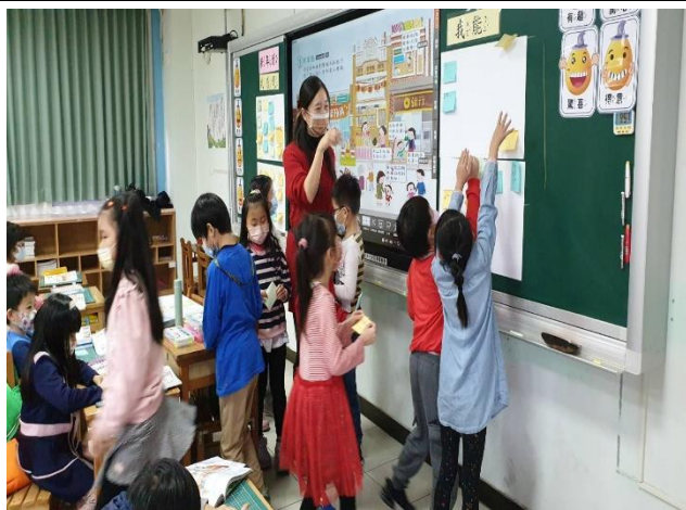
說明：「我能……」學生答案展示