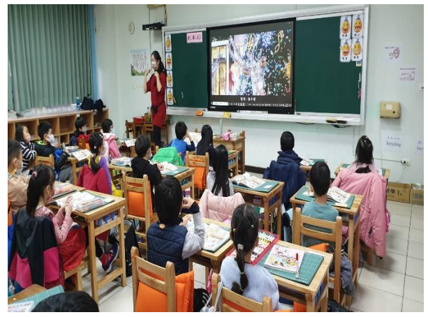
說明：專心觀看過新年影片