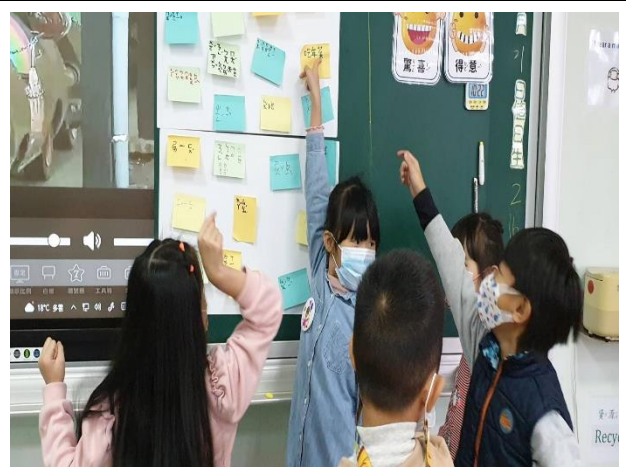
說明：討論分享彼此的答案