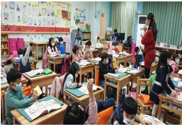
說明：學生專心聆聽，舉手回答