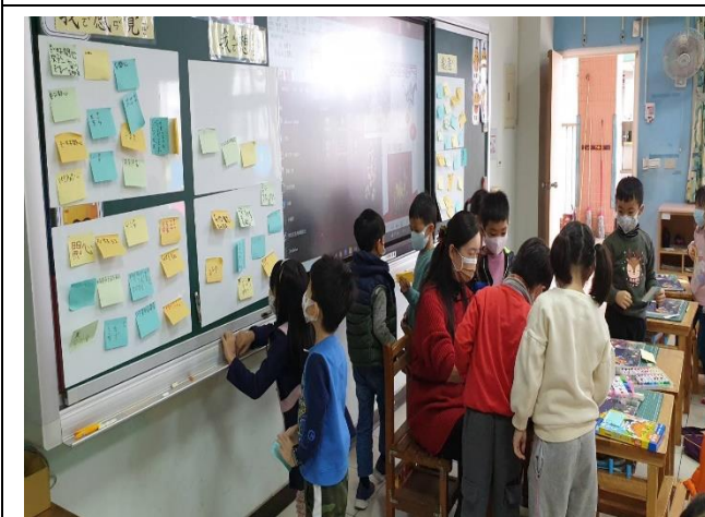
說明：老師統計集點分數鼓勵學生