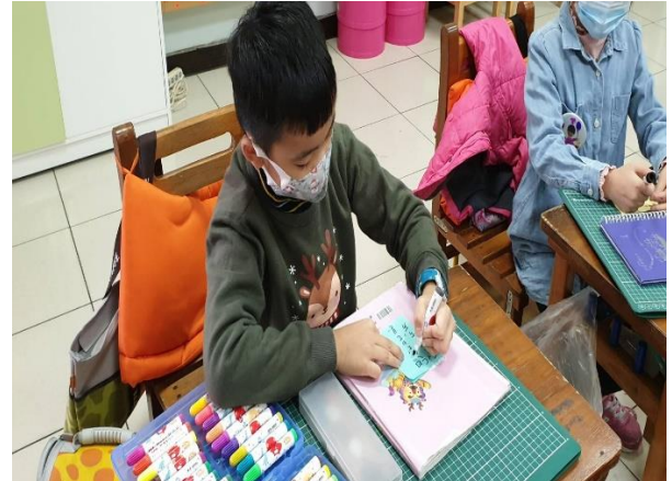
說明：老師提問，學生將想法寫在便利貼上