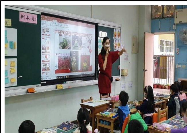
說明：介紹不同國家過新年的習俗