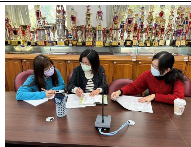
說明：觀課後之議課回饋