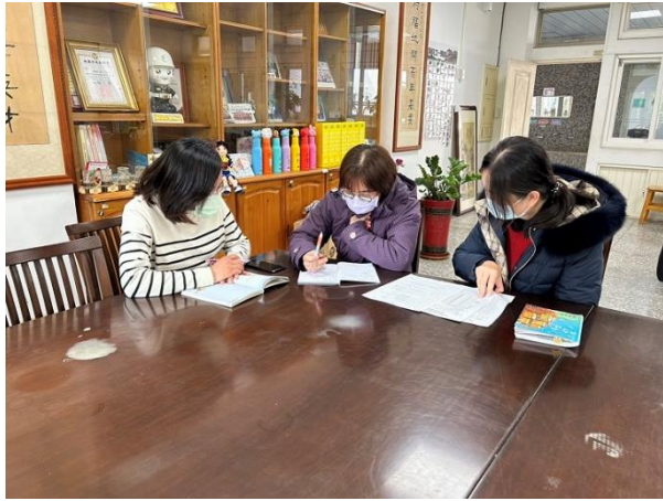
說明：共備討論課程架構及教學設計