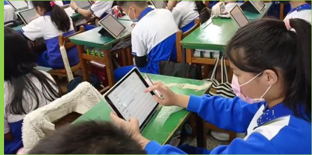
學生運用平板作答