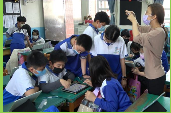
各組同學學生運用平板討論短文中的摹寫法