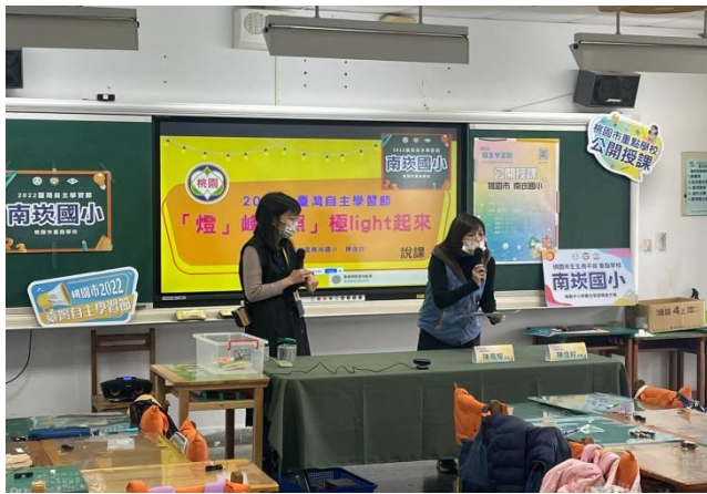
說明：主席致詞、授課教師心得分享