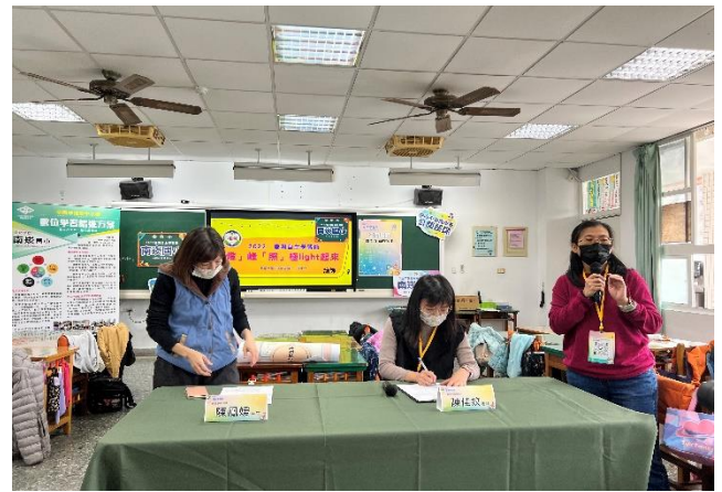
說明：觀課教師回饋