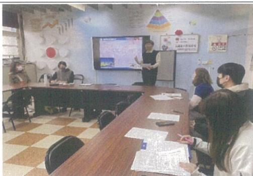
照片說明：庭禎老師進行授課後心得分享報告。