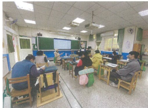
共備夥伴給予回饋