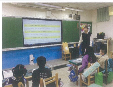
照片說明：共同欣賞各組上傳作品。