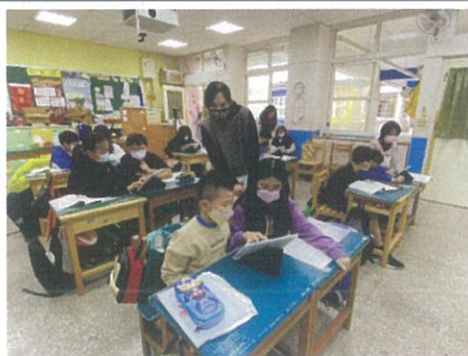
照片說明：學生兩兩一組運用平板進行摹寫練習及上傳作品。