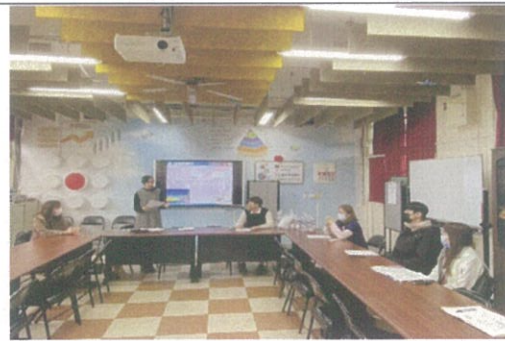
照片說明：觀課老師進行觀課後回饋與建議。