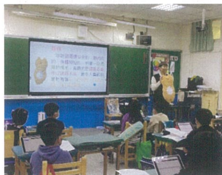
照片說明：透過布偶進行口說摹寫練習。