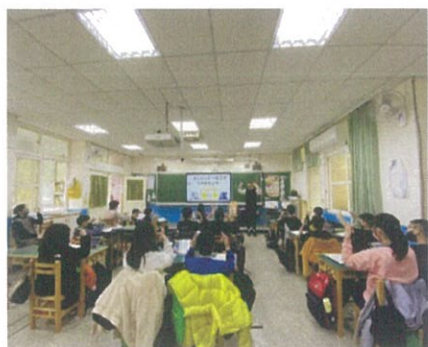
照片說明：引導學生進入情境主題。