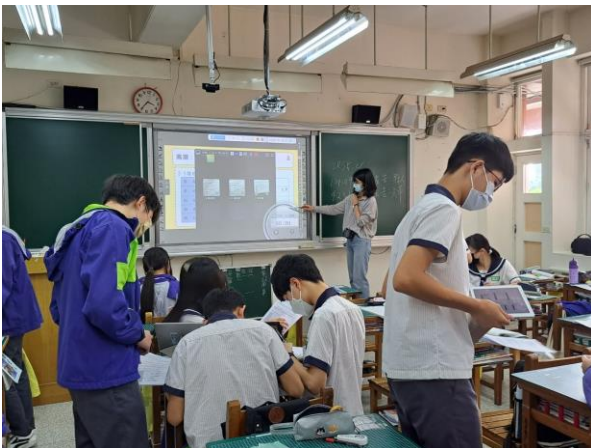
▲學生傳送討論結果給老師