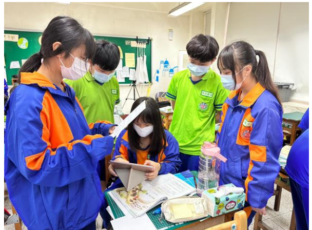
▲小組討論，並於平板紀錄共識