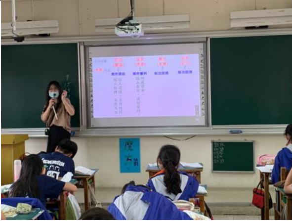
▲檢視閱讀：凱渝老師引導學生整理課文架構