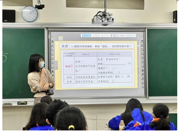
▲分析閱讀：雅能老師引導學生分析釋之觀點