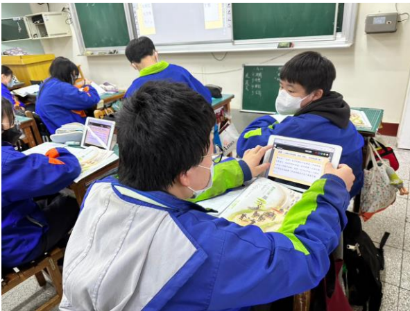
▲學生瀏覽老師傳送至平板的資料