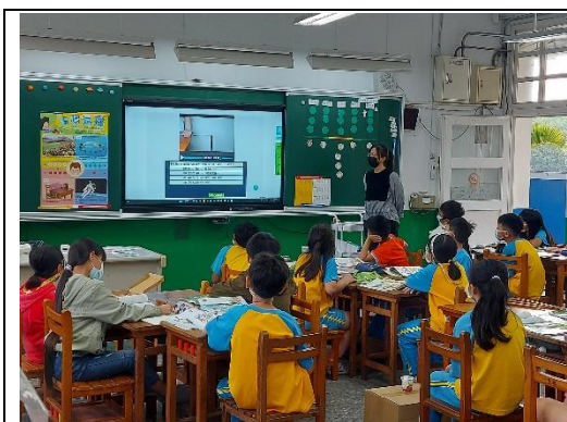
根據看完影片內容回答問題