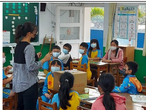
闖關第四關 鼓棒打擊紙箱小紙片