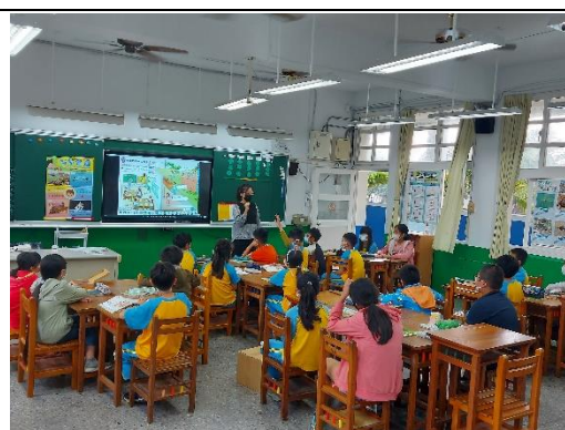
詢問聲音是透過哪些介質傳播