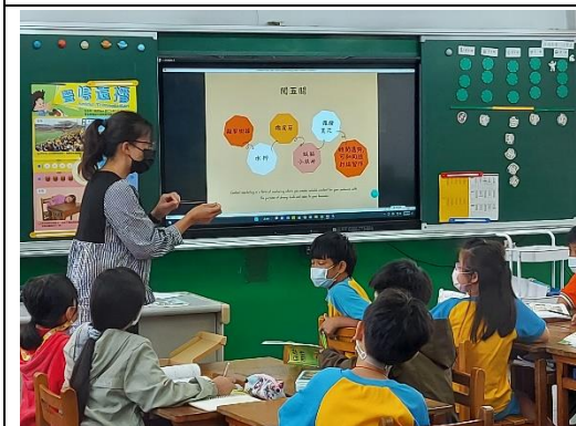
闖關第三關 彈播橡皮筋