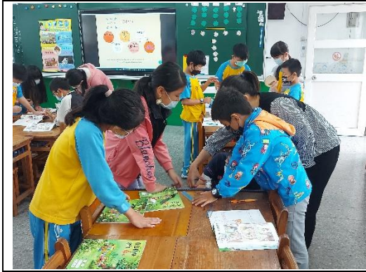
闖關第五關 彈撥直尺