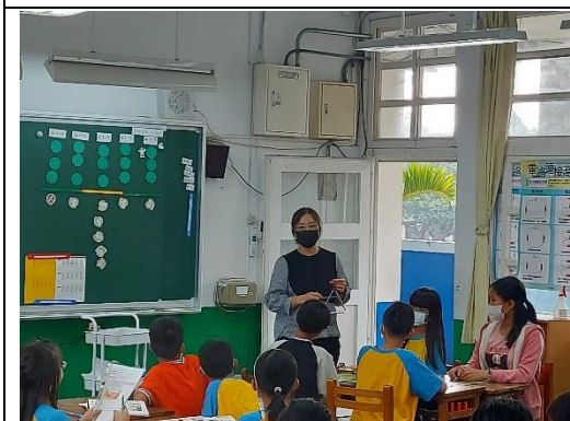
闖關第一關 三角鐵