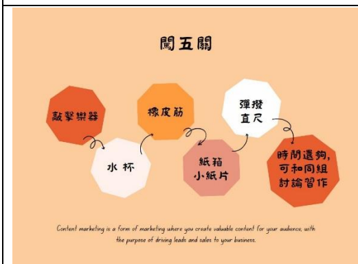
老師說明闖關遊戲規則和安全宣導