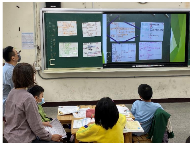
照片說明：第一堂課寫下對課文中美食的印象