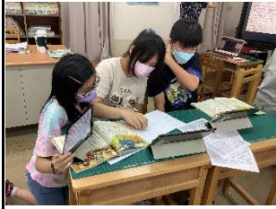
▲回歸文本進行深究

察不同角色如何被情緒影響？如何處理人際關係與溝通？如何進行決策？最後再將總結帶入日常生活中。