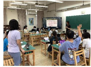
▲組間互學，學生提問

戰爭議題距離現代的孩子而言看似遙遠，但卻又近在咫尺。學生透過文本及歌詞，可以從文字敘述中理解戰爭所帶給百姓的苦難，但畢竟文本中的戰爭仍只活在小說中、精彩的情節中，對孩子而言缺乏實際感。因此在課程設計中從赤壁之戰的討論，帶回到現在正在發生的戰爭之中。孩子在社會領域課程中也正好上到有關全球性社會問題，因而在討論戰爭的過程中孩子能主動提出以巴戰爭、烏俄戰爭，接著再透過新聞媒體對於戰爭客觀的報導，引發孩子省思：我們都知道戰爭中的輸家無論在生活、經濟層面上，都遭受非常大的衝擊，然而贏家就真的贏了嗎？透過看到俄羅斯百姓因戰爭，育幼院老師帶著孩子們逃難的情景，最終孩子們得到的結論是一戰爭之下沒有贏家。也是藉由這樣的引導，讓孩子進一步去思考我們能以什麼樣的方式避免這些戰爭？孩子在閱讀流行歌歌詞時，《亂舞春秋》提到現代人搭著時光機回到三國時期，順著歌詞，在教學中回到課文本位，教師帶著孩子想像：如果有時光機，我們得以回到三國時期，你會如何力勸曹操不要輕而聽信他人的投降與戰術？如果能提醒曹操再謹慎思考，是否可以阻止這場殺戮的發生？