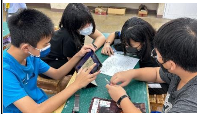
▲文本閱讀（流行歌歌詞）

戰爭議題距離現代的孩子而言看似遙遠，但卻又近在咫尺。學生透過文本及歌詞，可以從文字敘述中理解戰爭所帶給百姓的苦難，但畢竟文本中的戰爭仍只活在小說中、精彩的情節中，對孩子而言缺乏實際感。因此在課程設計中從赤壁之戰的討論，帶回到現在正在發生的戰爭之中。孩子在社會領域課程中也正好上到有關全球性社會問題，因而在討論戰爭的過程中孩子能主動提出以巴戰爭、烏俄戰爭，接著再透過新聞媒體對於戰爭客觀的報導，引發孩子省思：我們都知道戰爭中的輸家無論在生活、經濟層面上，都遭受非常大的衝擊，然而贏家就真的贏了嗎？透過看到俄羅斯百姓因戰爭，育幼院老師帶著孩子們逃難的情景，最終孩子們得到的結論是一戰爭之下沒有贏家。也是藉由這樣的引導，讓孩子進一步去思考我們能以什麼樣的方式避免這些戰爭？孩子在閱讀流行歌歌詞時，《亂舞春秋》提到現代人搭著時光機回到三國時期，順著歌詞，在教學中回到課文本位，教師帶著孩子想像：如果有時光機，我們得以回到三國時期，你會如何力勸曹操不要輕而聽信他人的投降與戰術？如果能提醒曹操再謹慎思考，是否可以阻止這場殺戮的發生？