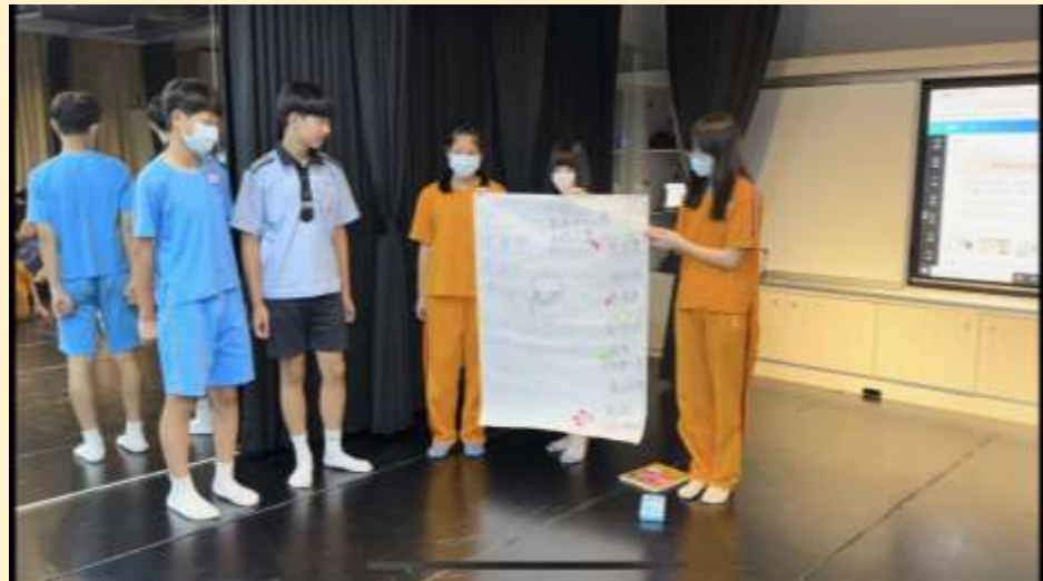
<利用好奇啟動同理活動>提出好奇的兩個印象並推測其需求與想法。