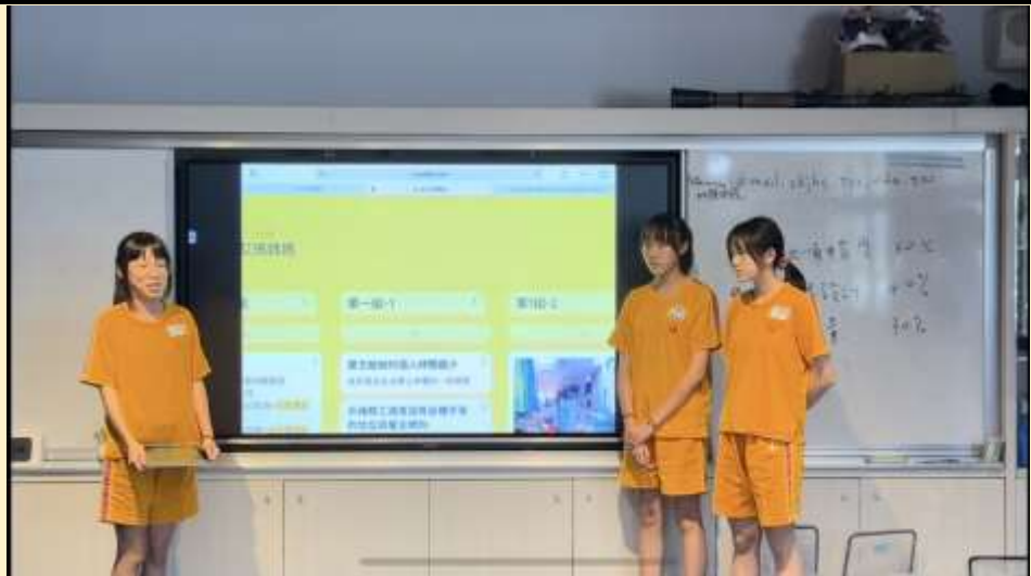
小組報告文本困境與支持。