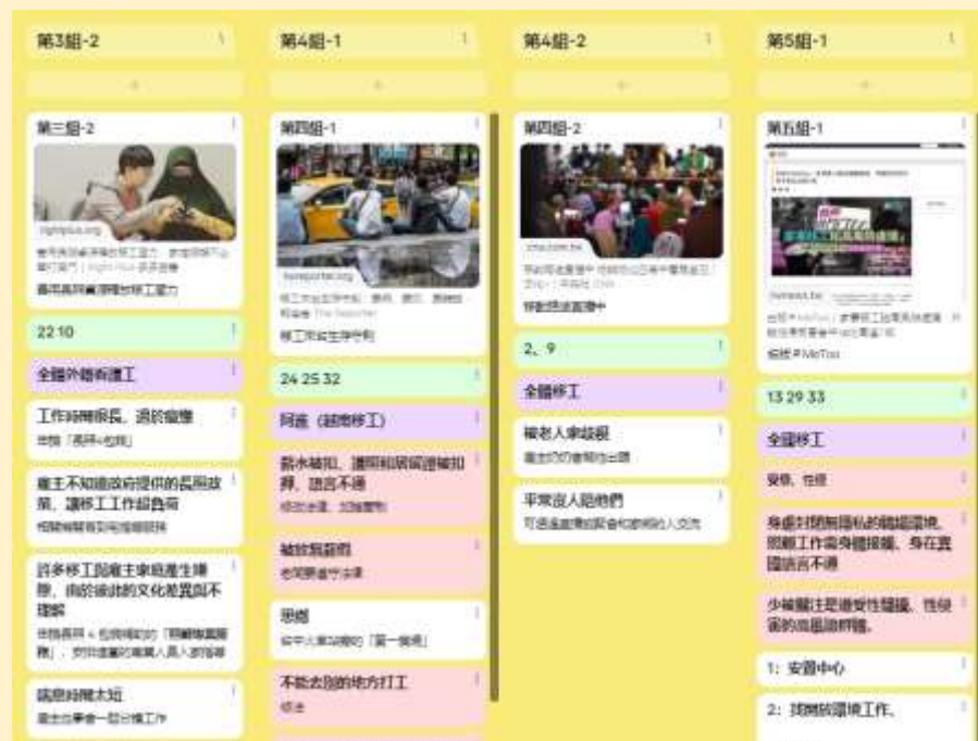
小組將討論後的支持與困境書寫於 padlet 上。