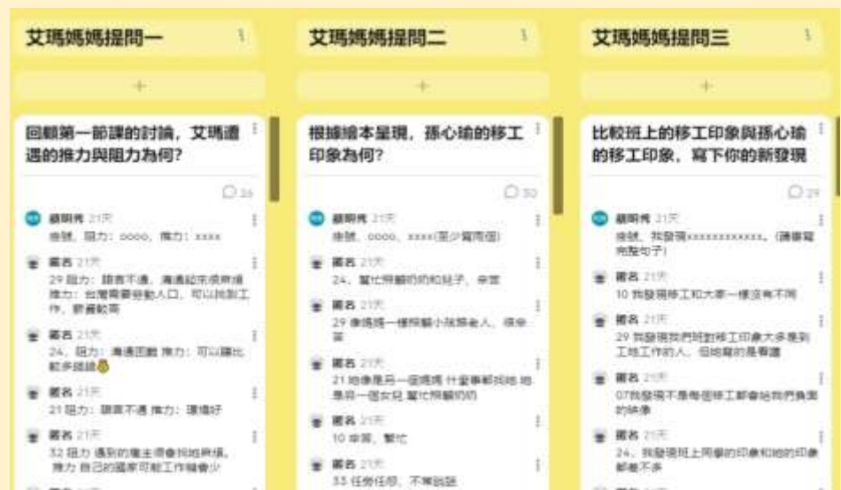
學生回覆三個提問，覺察自己的刻板印象與偏見