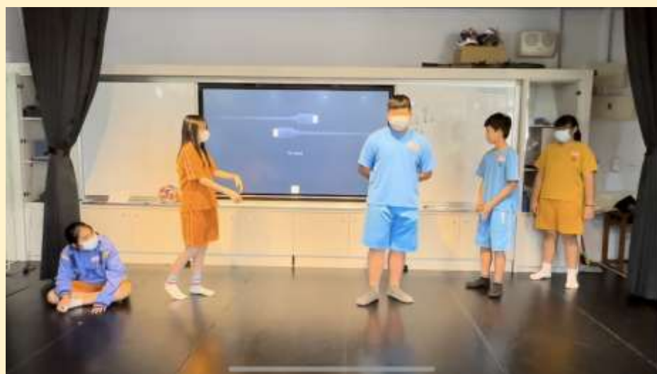
小組運用思路追蹤策略，演出各角色內心話。