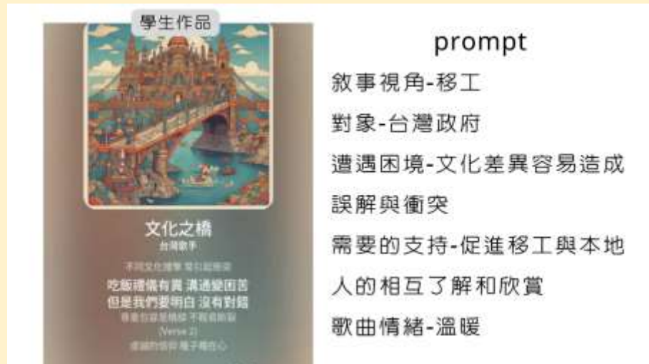
學生透過 AI 創作倡議歌曲。