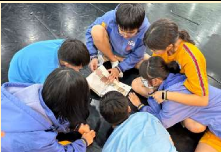
小組一同閱讀艾瑪媽媽繪本