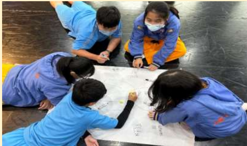
小組繪製牆上的角色-移工印象